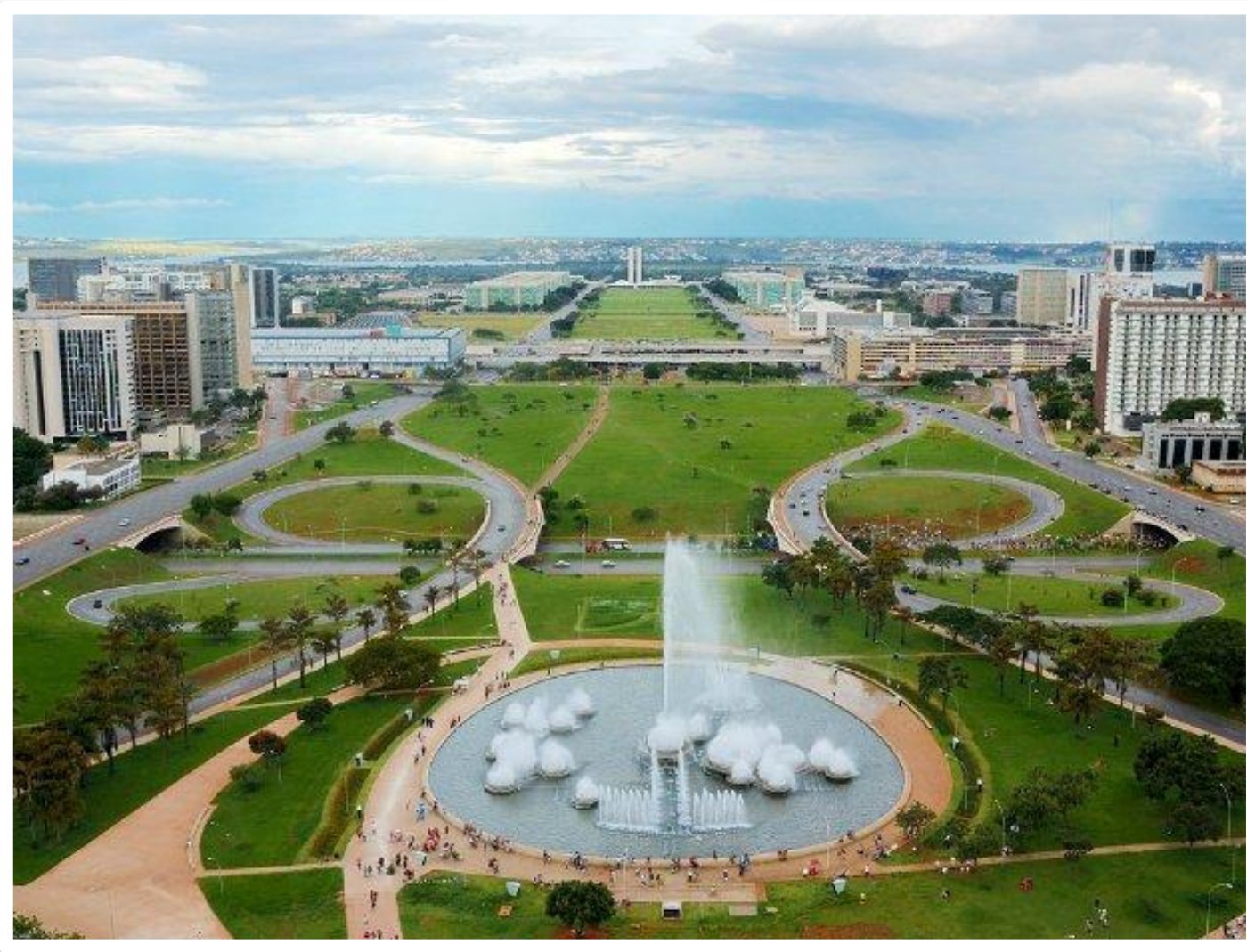
Площадь Трёх властей