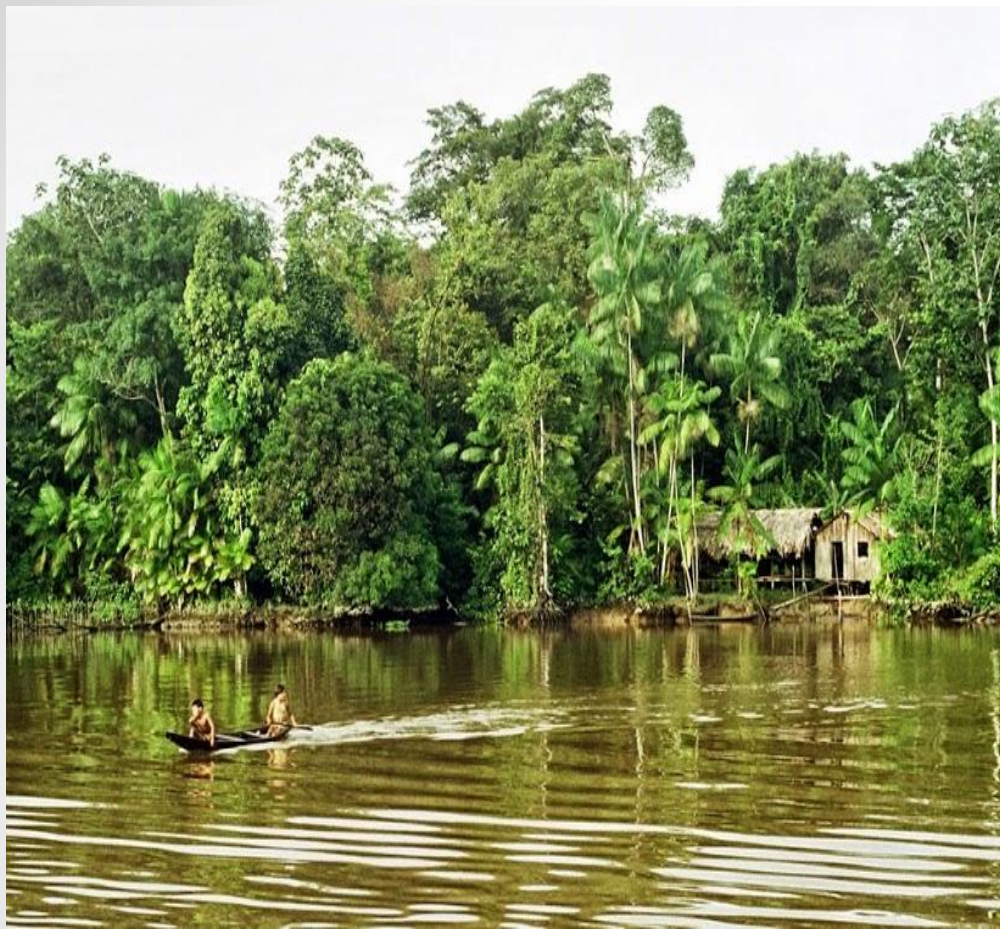
● Типичный дом в Амазонии.