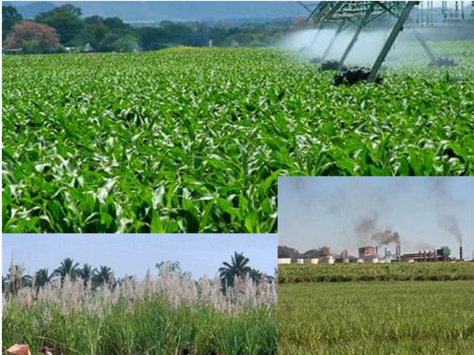
выращиванию сахарного тростника