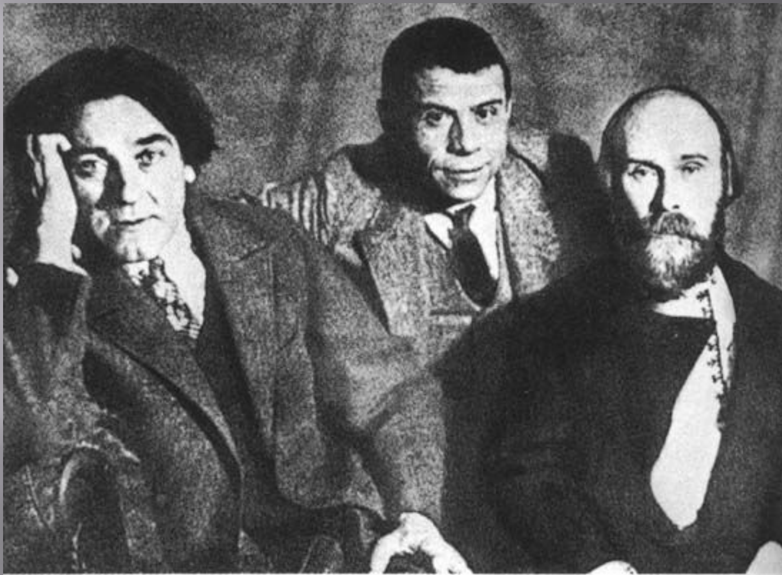
▣ Сергей Клычков, Пётр Орешин, Николай Клюев.