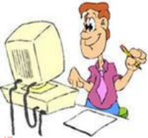
СХЕМА САМОАНАЛИЗА УЧЕБНОГО ЗАНЯТИЯ