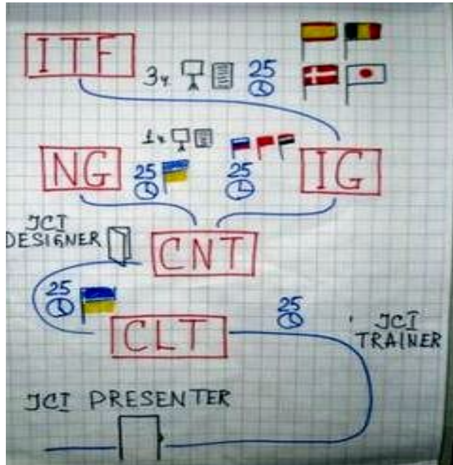
Схема тренерской карьеры в JCI