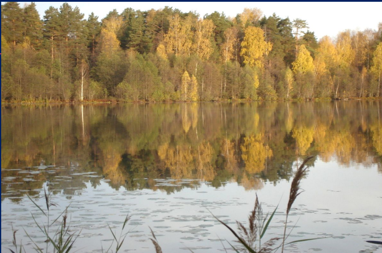
Светлояр. Фото 5.10.2008 г.