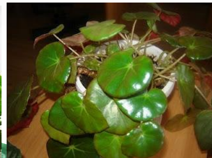
Слонско о ухо