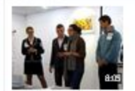
Промокадрат пресса "Агробизнес-инкубатор" от команды "Они-вакханты"