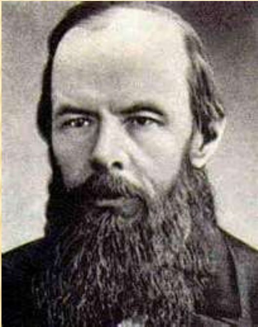
Ф.М. Достоевский, русский писатель

«Во всякое переходное время подымается эта сволочь, которая есть в каждом обществе. Между тем эти дряннейшие людишки получили вдруг перевес, стали громко критиковать все священное, тогда как прежде и рта не смели раскрыть».