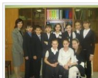
Совет Умников, учащиеся средней школы №177