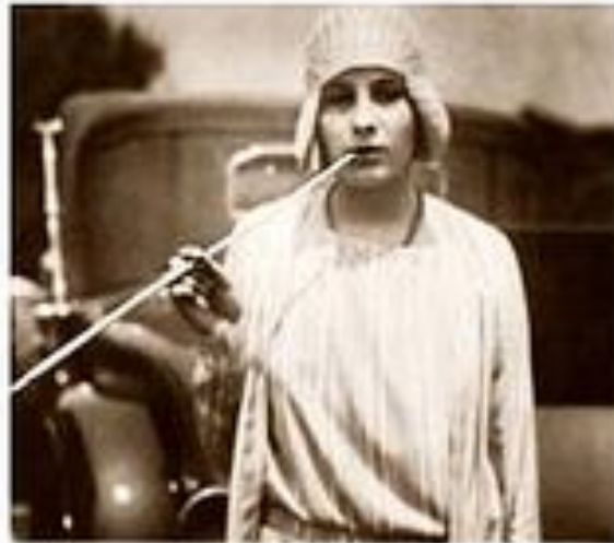
"torches of freedom"