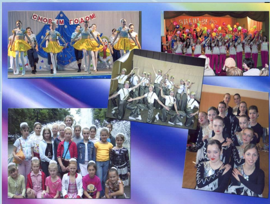
Народный хореографический коллектив "Эдельвейс"