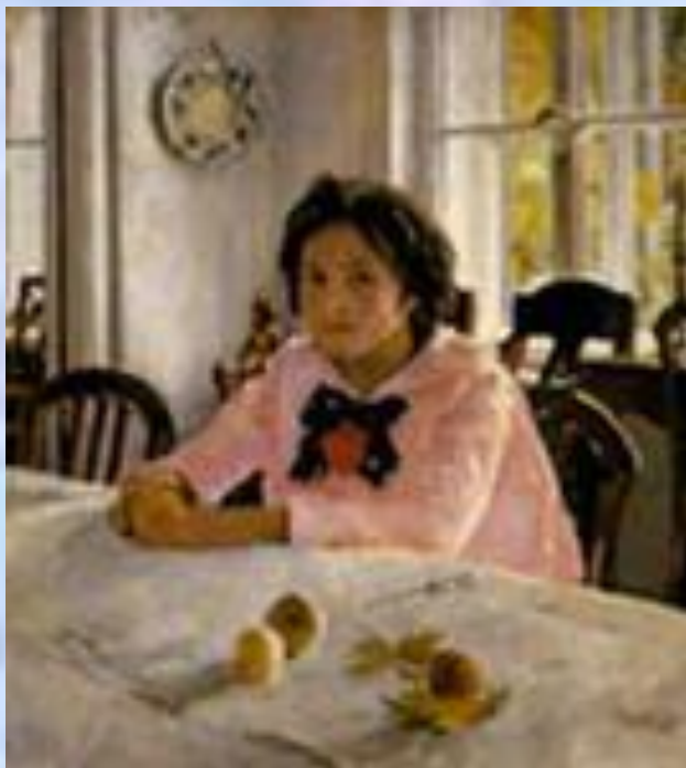
В. А. Серов «Девочка с персиками»

На другой день поутру я только что стал одеваться, как дверь отворилась и ко мне вошел молодой офицер невысокого роста, с лицом смуглым и отменно некрасивым, но чрезвычайно живым (А. С. Пушкин «Капитанская дочка»)