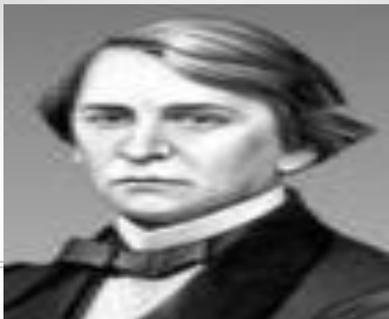
Плещеев Алексей Николаевич