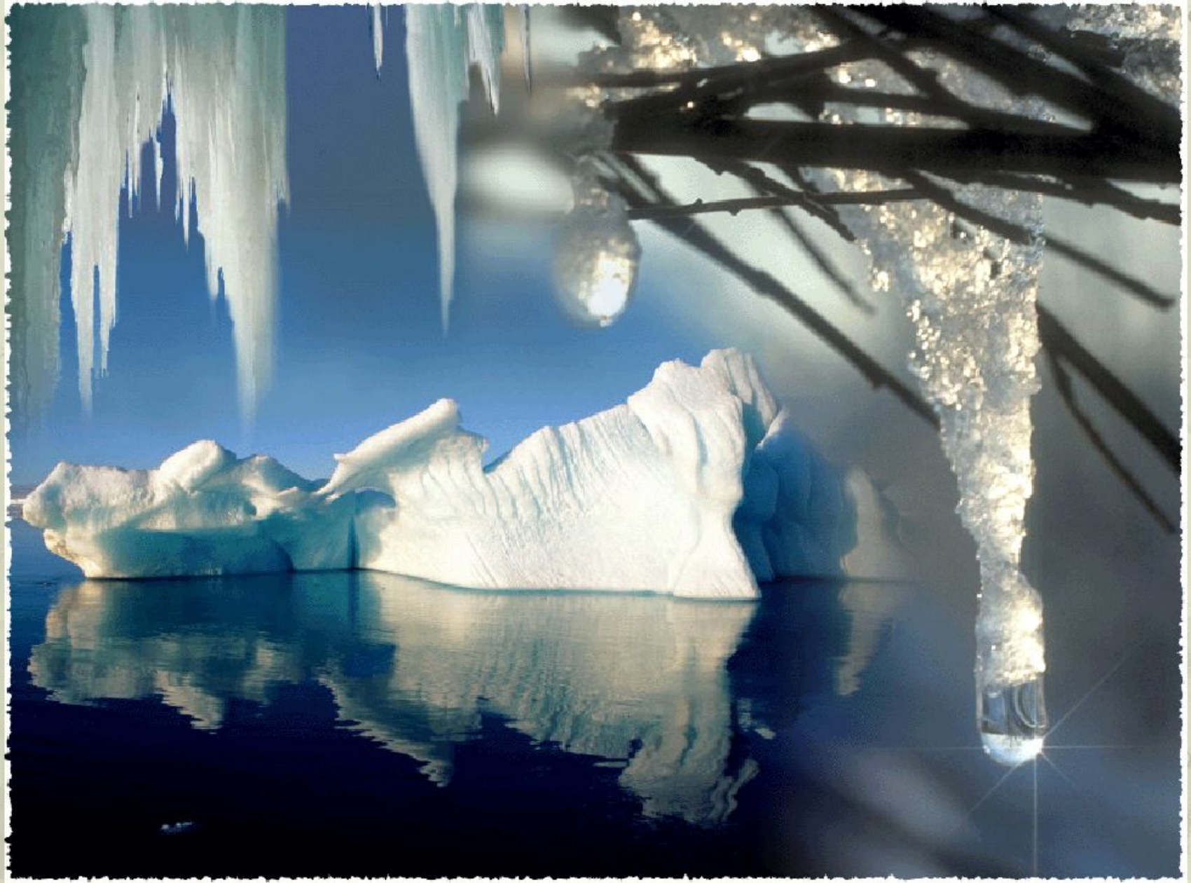
Вода в различных агрегатных состояниях.