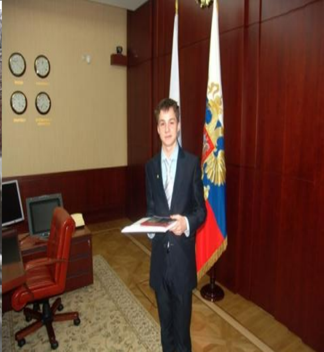
В кабинете у президента (13 лет)