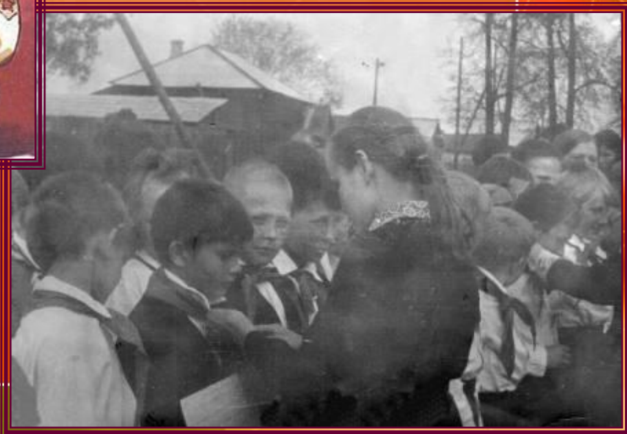
Торжественный прием в пионеры