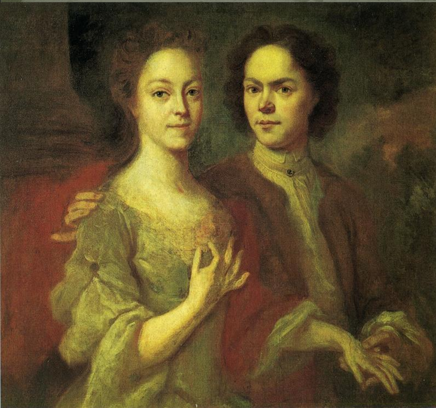
А. Матвеев. Автопортрет с женой.