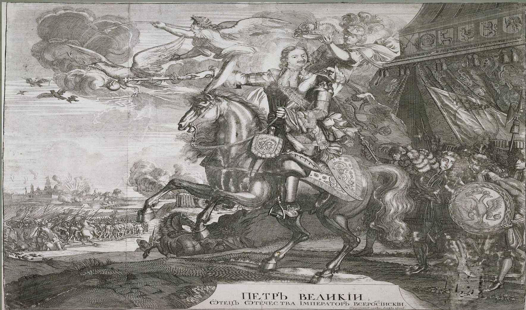
ПЕТРЪ ВЕЛИКІИ ОТЕЦЪ СѢТЕЧЕСТВА ІМПЕРАТОРЪ ВСЕРОССІИСКІИ.