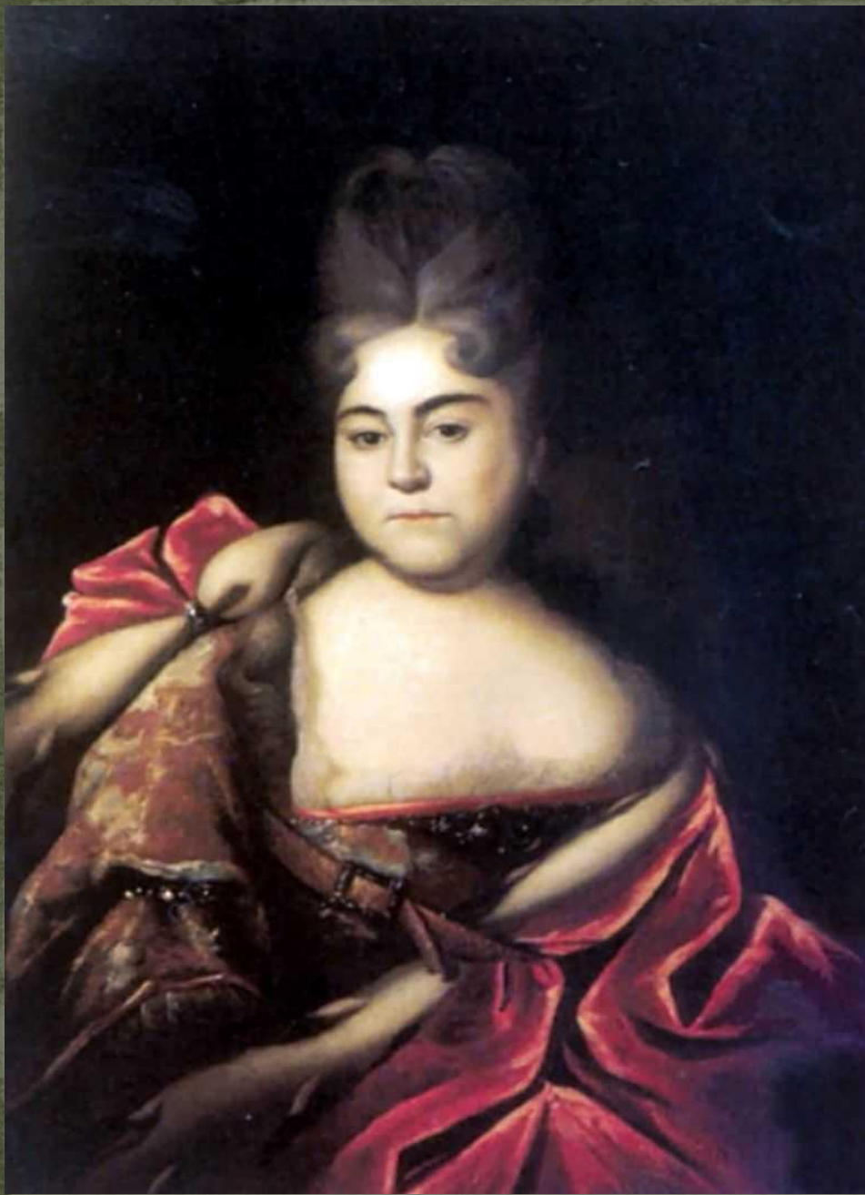
И. Никитин. Портрет царевны Натальи Алексеевны