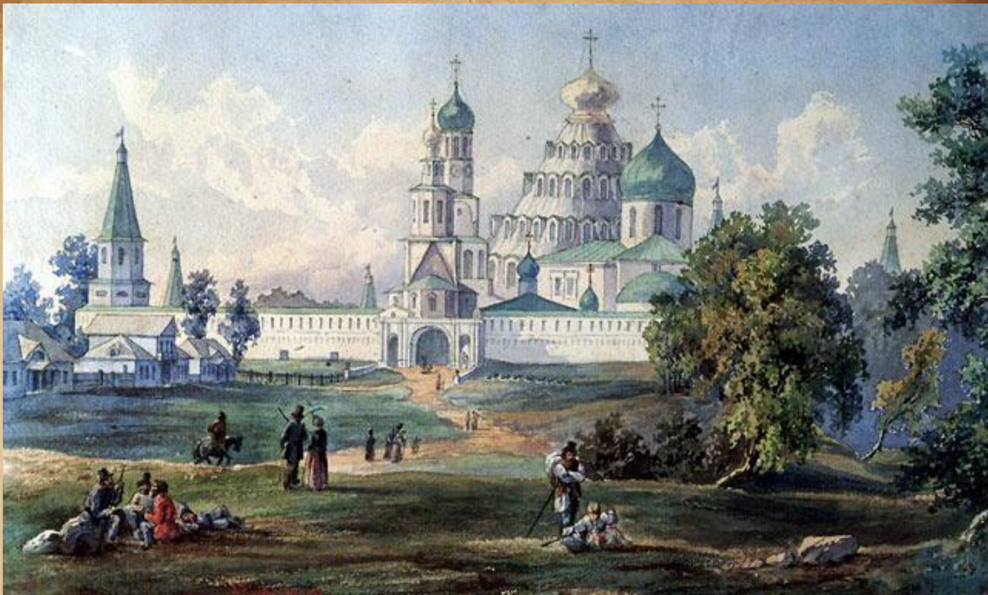
Воскресенский монастырь под Москвой, именуемый «Новым Иерусалимом»,