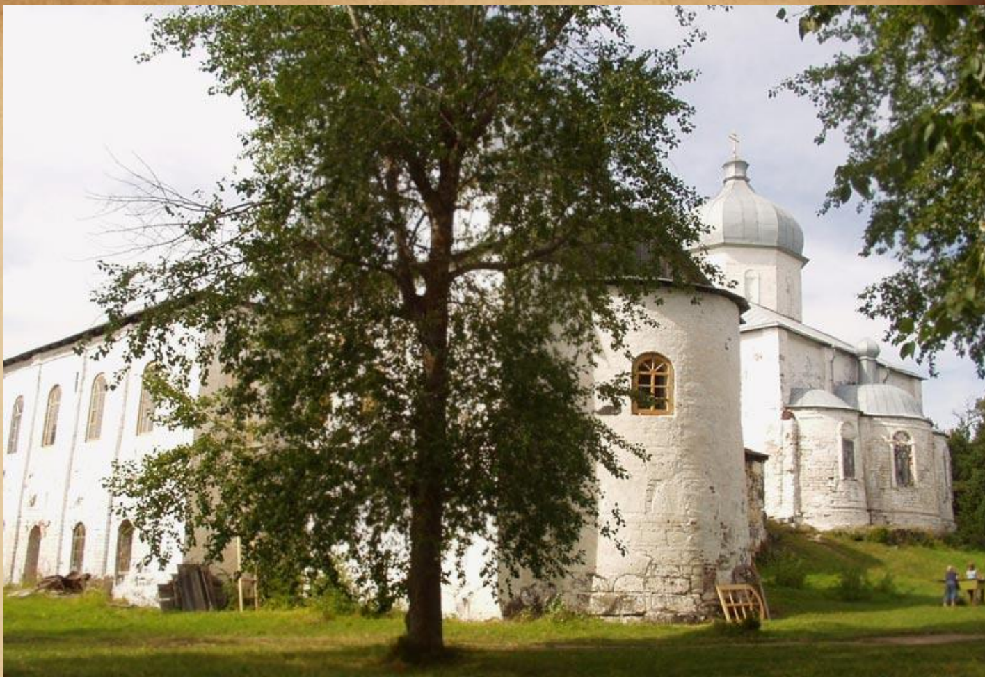
Крестный Кийостровский монастырь в Онежской губе.