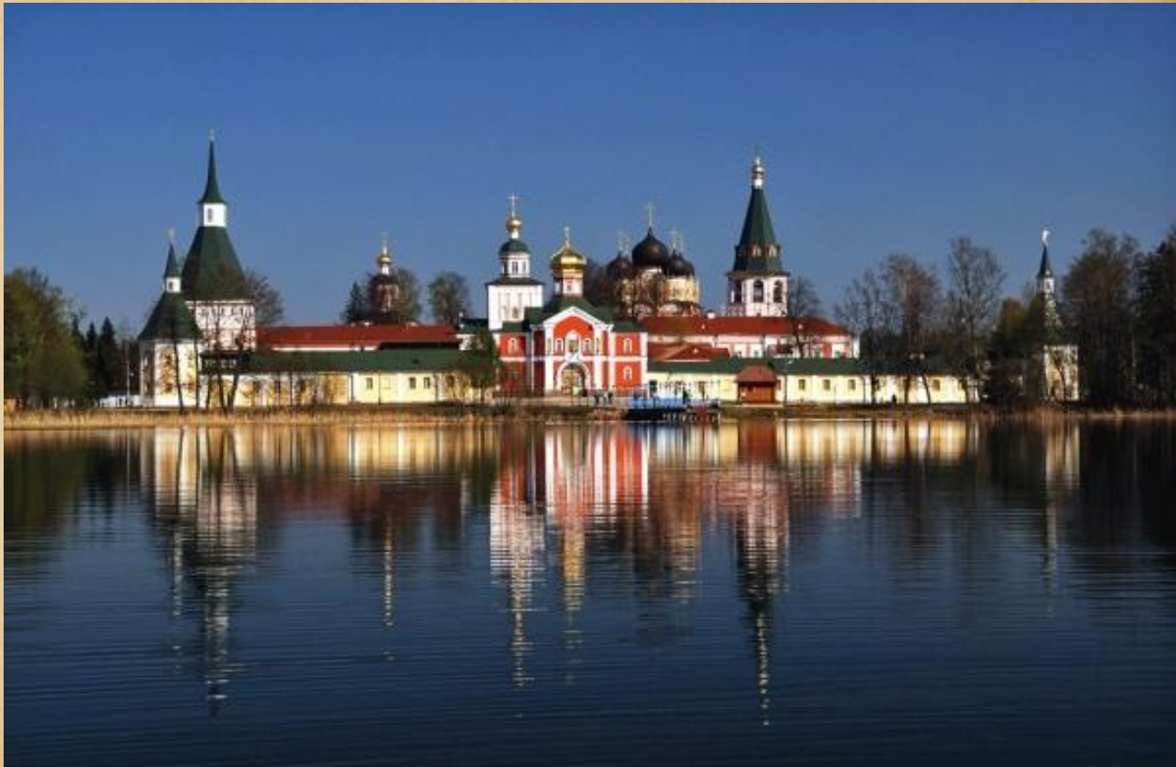
Иверский Святоозерский монастырь на Валдае

Первосвятитель всячески поощрял церковное строительство, сам он был одним из лучших зодчих своего времени. При Патриархе Никоне были сооружены богатейшие монастыри Православной Руси: