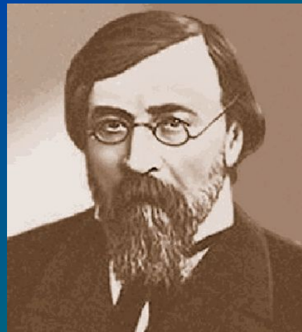
А.И.Герцен (либерал- славянофил)