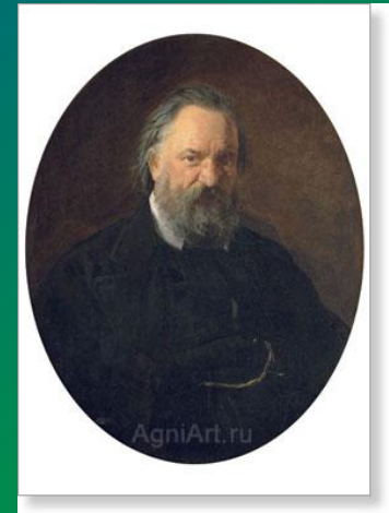
Н.Г. Чернышевский (революционер- демократ)