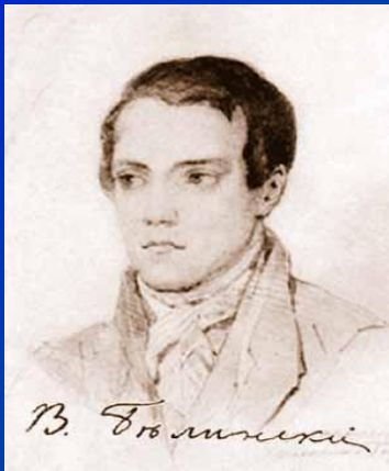
В.Г.Белинский (либерал- западник)