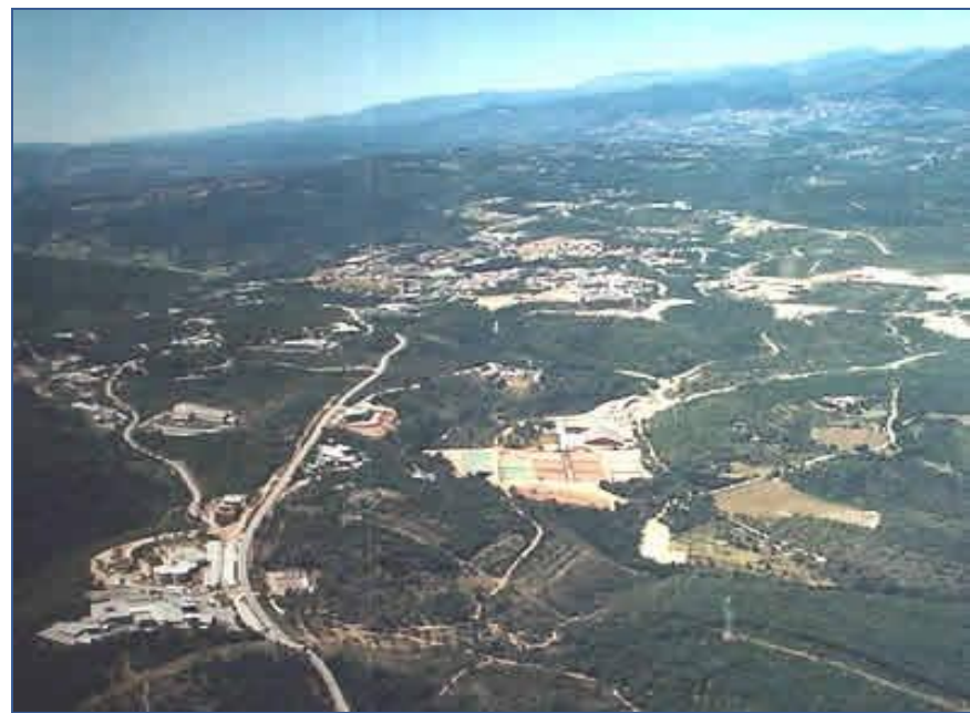
София Антиполис в 2005