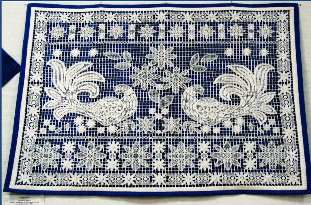
Изделие фабрики «Гипюр»