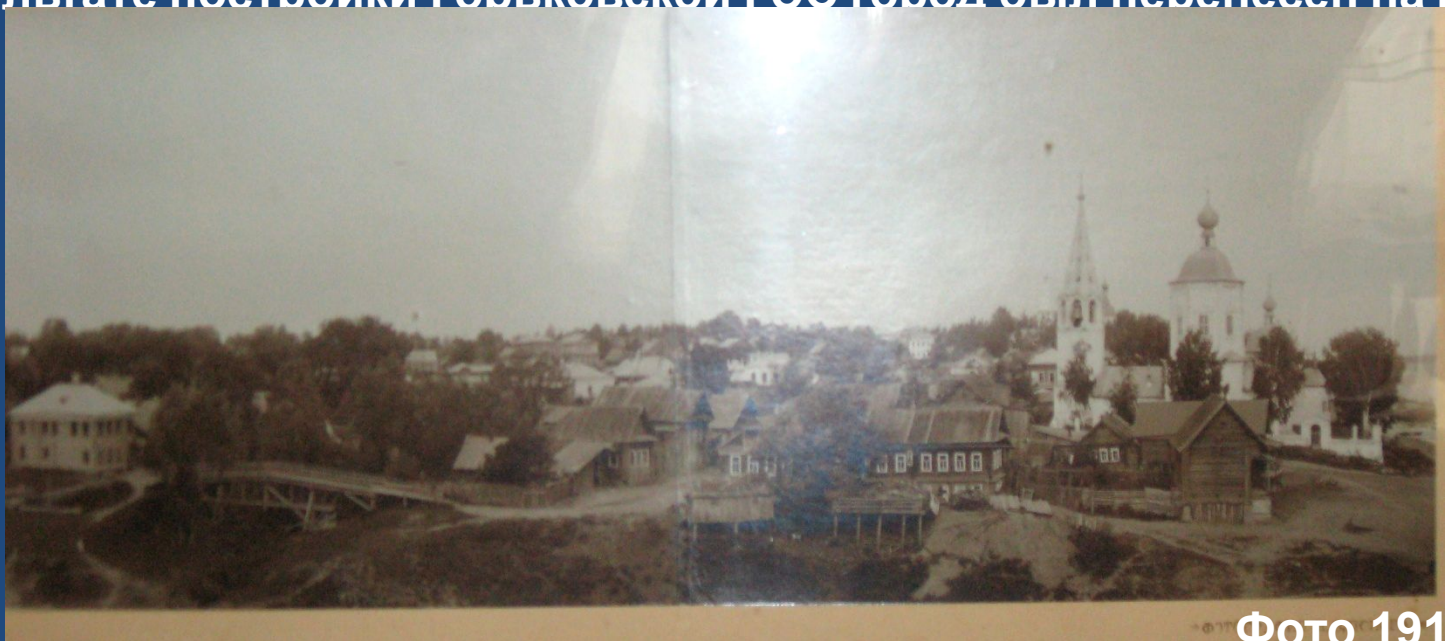
Фото 1910 года

Чкаловск – город в 100 км к северо-западу от Нижнего Новгорода. Чкаловск возник в 12 веке под названием Василёва Слобода. Основанная сыном Юрия Долгорукова Василием Василёва Слобода была родовой вотчиной Шуйских, в том числе царя Василия Шуйского. Жители Слободы занимались бурлачеством, гончарным и строчевышивальным промыслом, судостроением. Здесь родился великий лётчик В.П. Чкалов. В 1937 году посёлок переименовали в его честь. С Чкаловском связаны имена Героев Советского Союза В.В. Клочкова, А.П. Корякова и Р.С. Гашевой. В 1955 году посёлок Чкаловск получил статус города. В результате постройки Горьковской ГЭС город был перенесён на новое