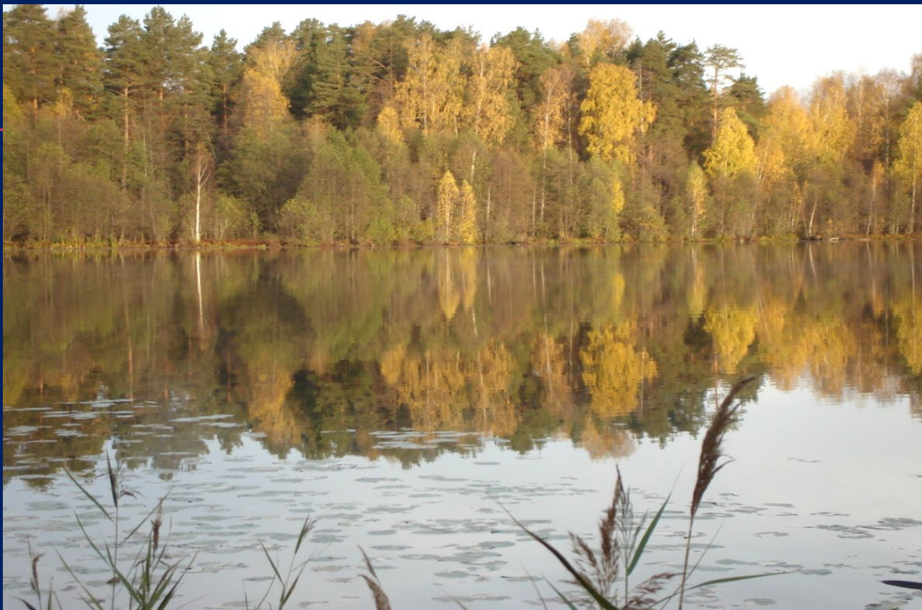
Светлояр. Фото 5.10.2008 г.