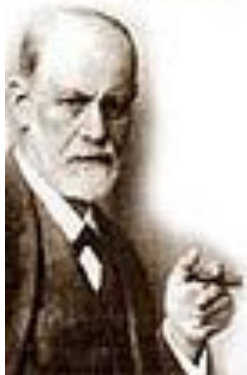
uncle Siggy (1856-1939)