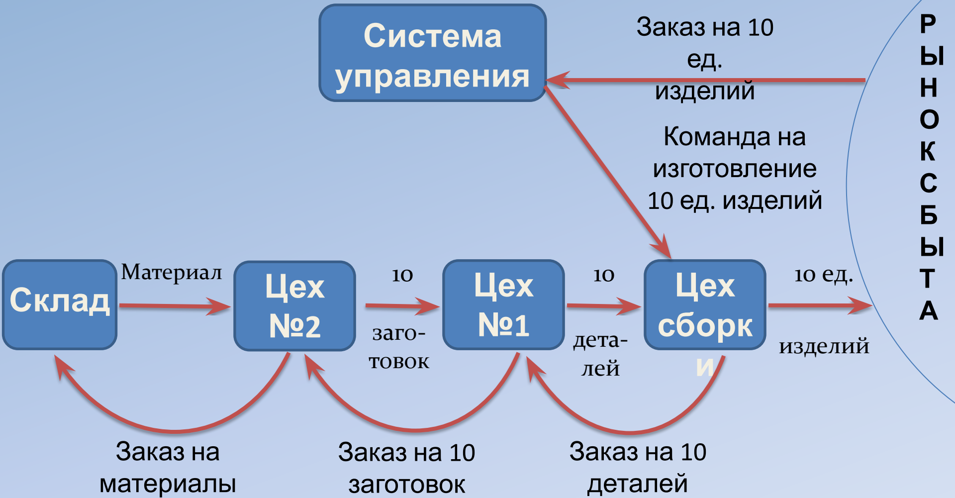
Выталкивающая система управления материальными потоками