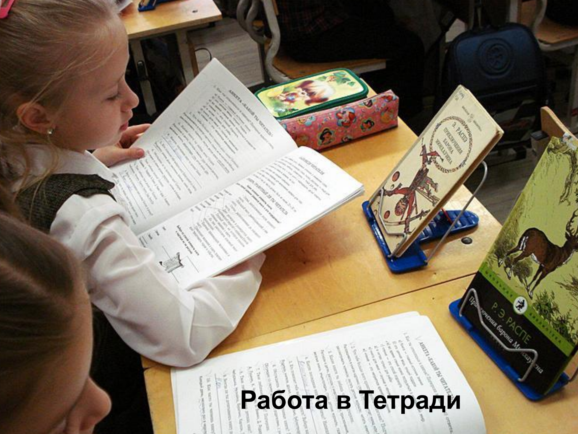
Работа в Тетради