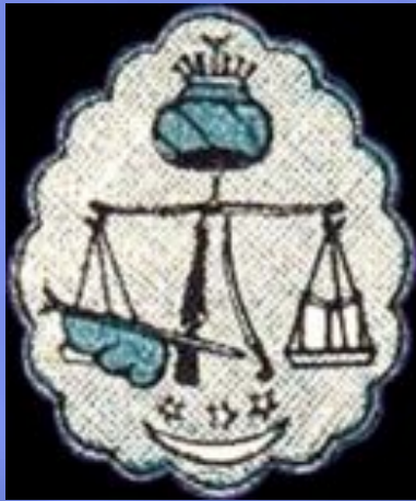
Герб Северо-Кавказского эмирата