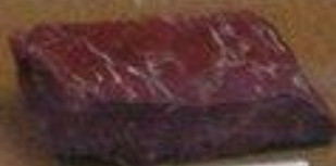
Охровый гранат-биотитовый кварц