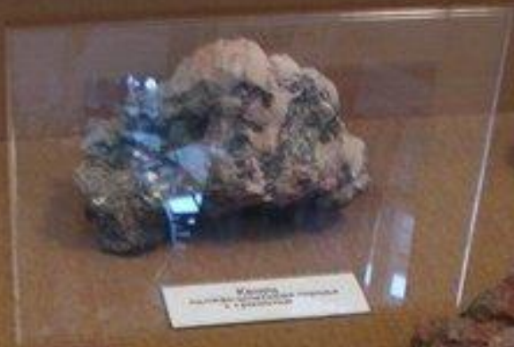
Гарнет синевато-голубой, прозрачный и блестящий