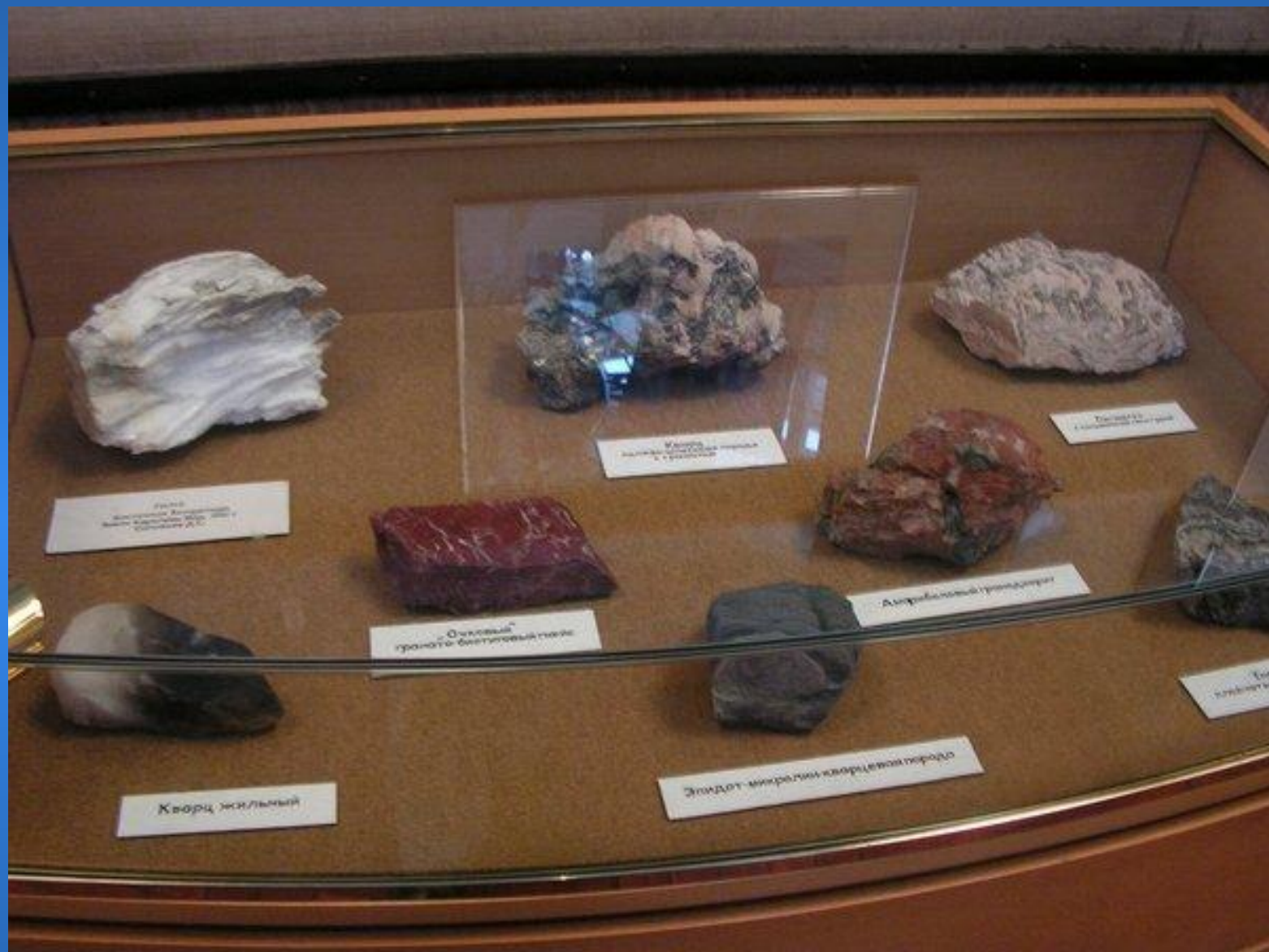
Кварц массивный, изоморфный слюдам, с примесью биотита и хлорита А.С.