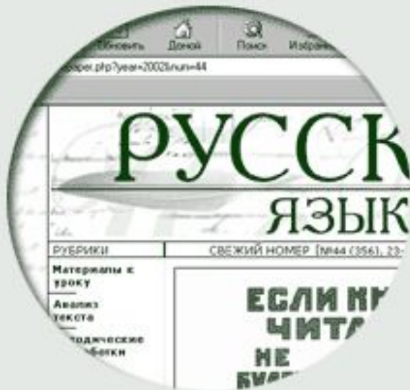
Электронная версия газеты «Русский язык»