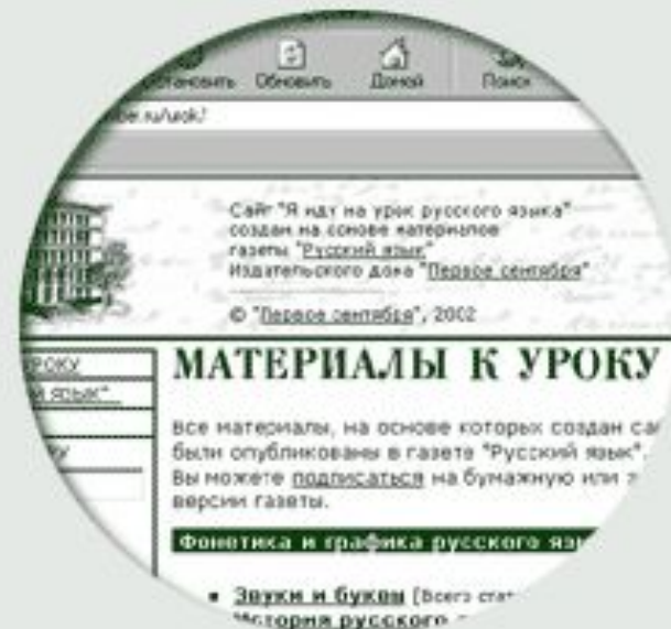
Сайт для учителей «Я иду на урок русского языка»