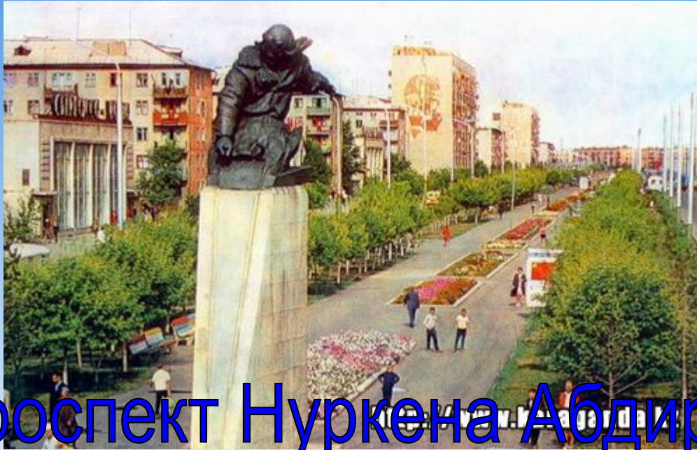
проспект Нуркена Абдирова

10. Проспект названный в честь отважного лётчика, Героя Советского Союза?