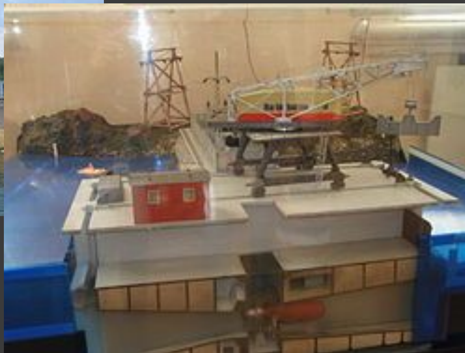
Макет Кислогубской приливной электростанции,