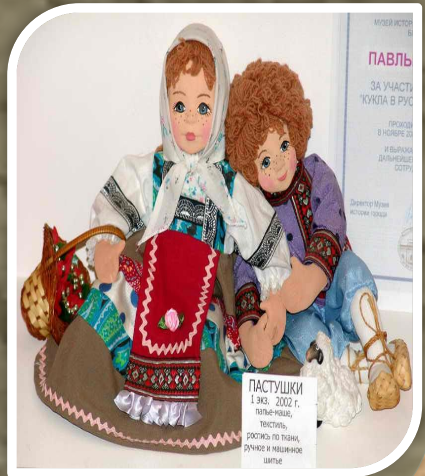
ПАСТУШКИ 1 экз. 2002 г. папье-маше, текстиль, роспись по ткани, ручное и машинное шитье