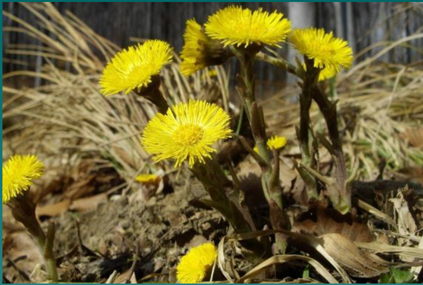
Мать – и – мачеха