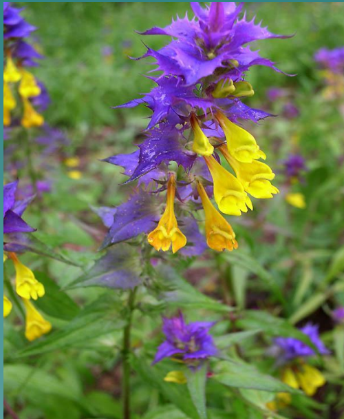
Иван – да – Марья