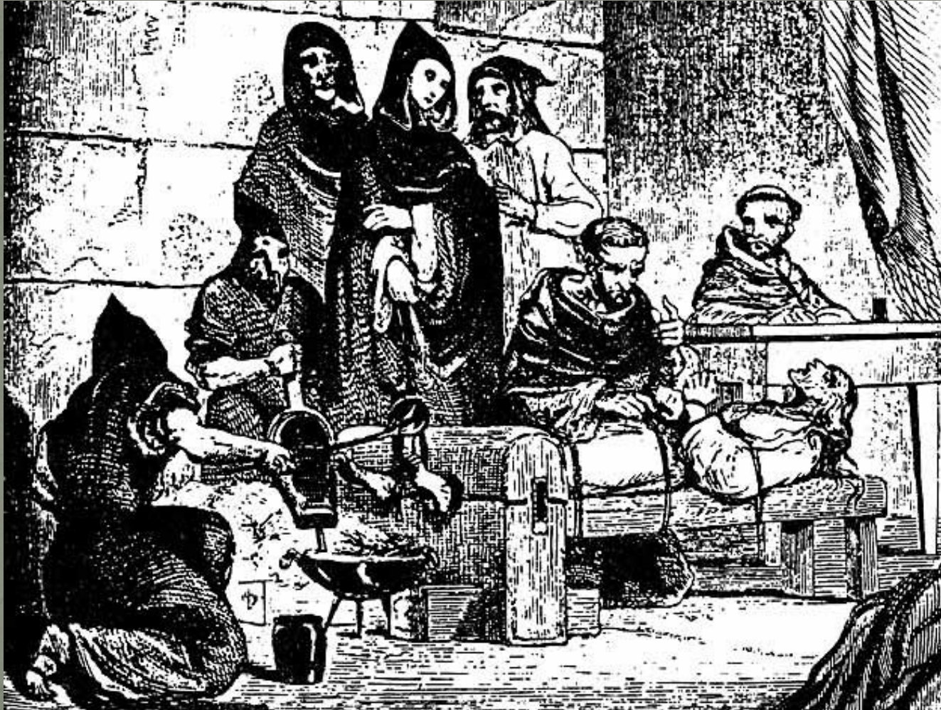
Иллюстрация к "Истории инквизиции М. де Фереа. XIX в.