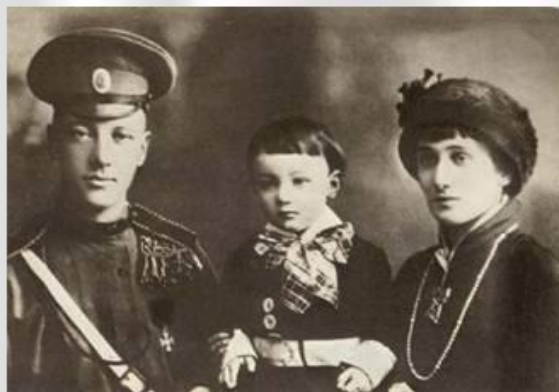
Л. Гумилев с родителями

«Уводили тебя на рассвете, За тобой, как на выносе, шла, В тёмной горнице плакали дети, У божницы свеча оплыла».