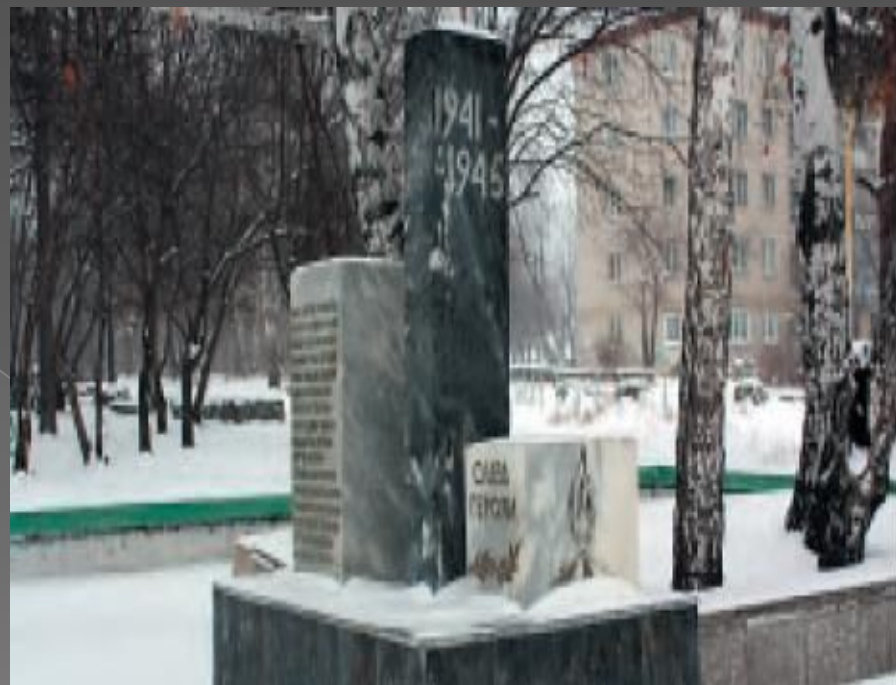
Октябрьский район. Микрорайон Птицефабрика, ул. Сажинская