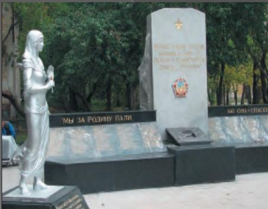
Октябрьский район. Микрорайон Компрессорный, ул. Латвийская