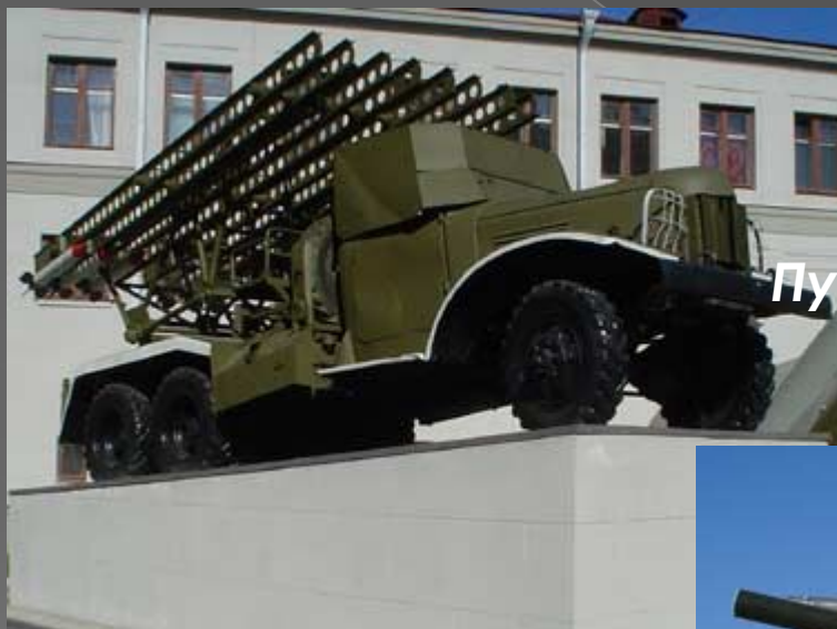
"Катюша" Установлена у Дома офицеров.

Пушка Пушки стоят у входа в Суворовское училище.