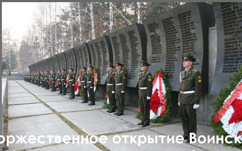
Торжественное открытие Воинского Мемориала состоялось 9-го мая 1975 г.-

Мемориальная стена-ограда, с увековечиванием памяти всех участников Великой Отечественной войны, скончавшихся в госпиталях г. Свердловска и захороненных на кладбищах города. На Мемориальной стене-ограде укреплены 18 щитов, на которых в алфавитном порядке бронзовыми рельефными буквами обозначены фамилии и инициалы 1 532 солдат и офицеров.