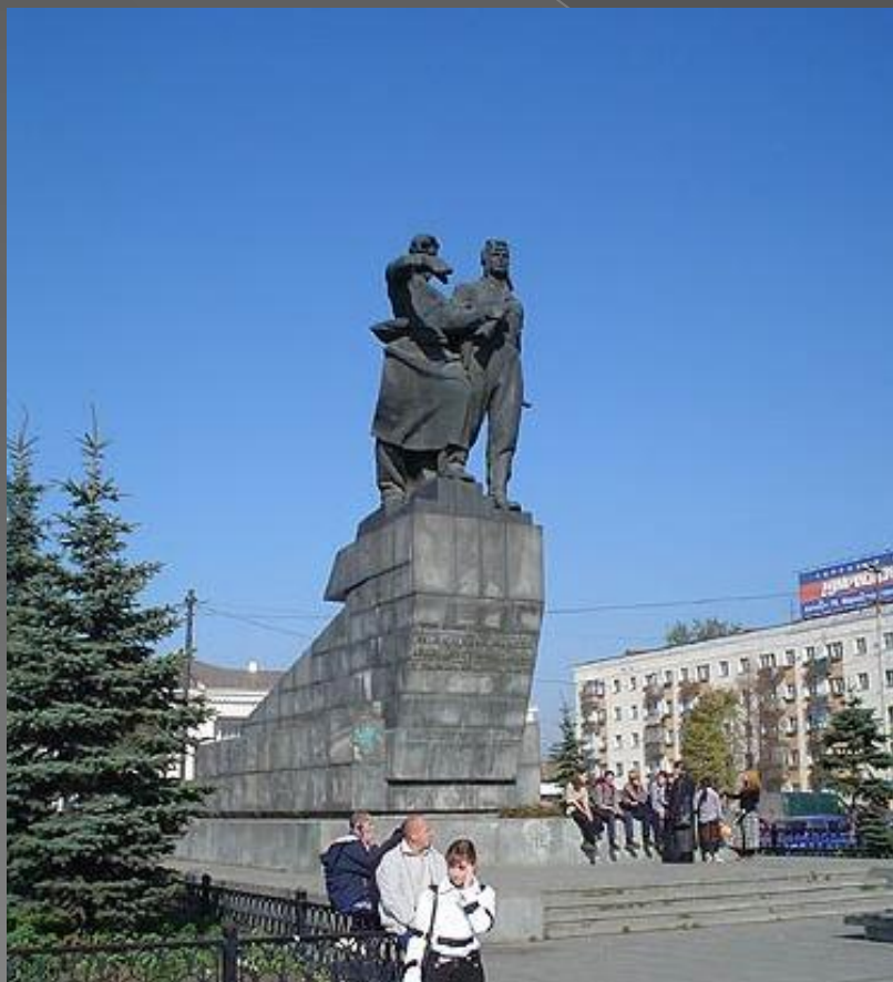
Монумент установлен в 1962 г.

Этот памятник встречает гостей Екатеринбурга на Привокзальной площади .