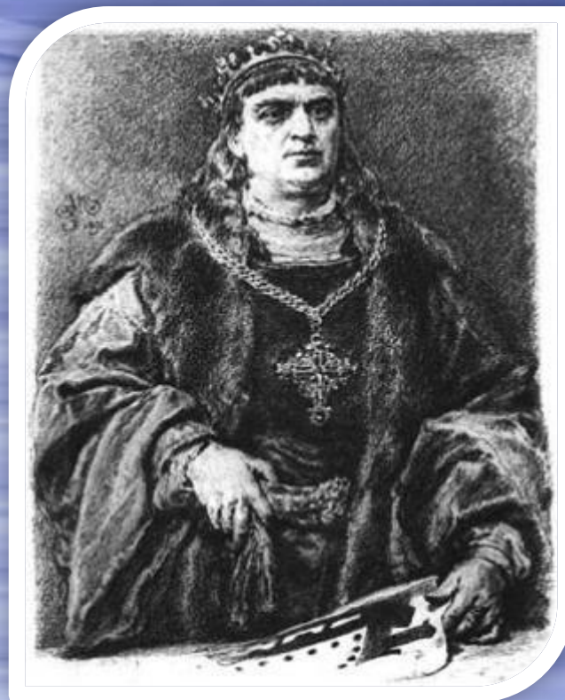
Сигизмунд I Старого

Сигизмунда 1 Старого с целью возвращения своей прежней роли в государстве.