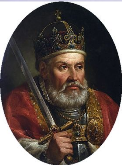
Сигизмунд I Старый

Сигизмунд I Старый содействовал развитию образования, науки и искусства, чему способствовала и его жена – итальянка Бона Сфорца.