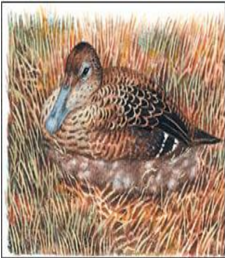
Рис.57. Примеры адаптаций: 1 — гага на гнезде: ее покровительственная окраска делает птицу малозаметной; 2 — бабочка березовой пяденицы на коре