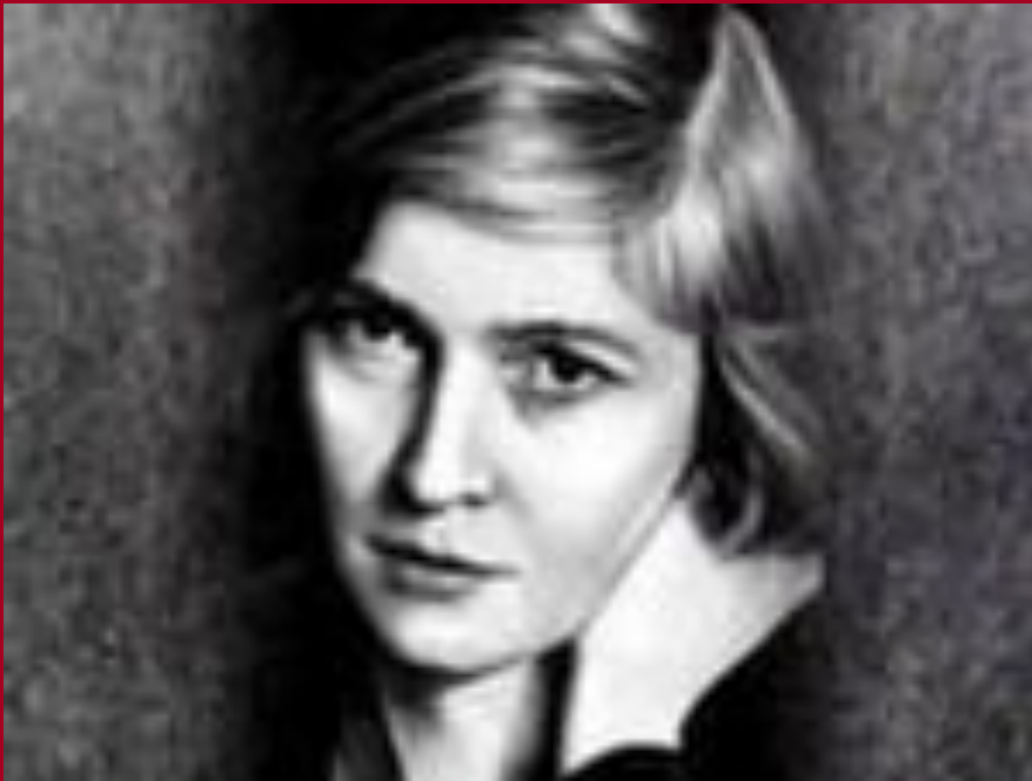
Поэт Ленинградской блокады