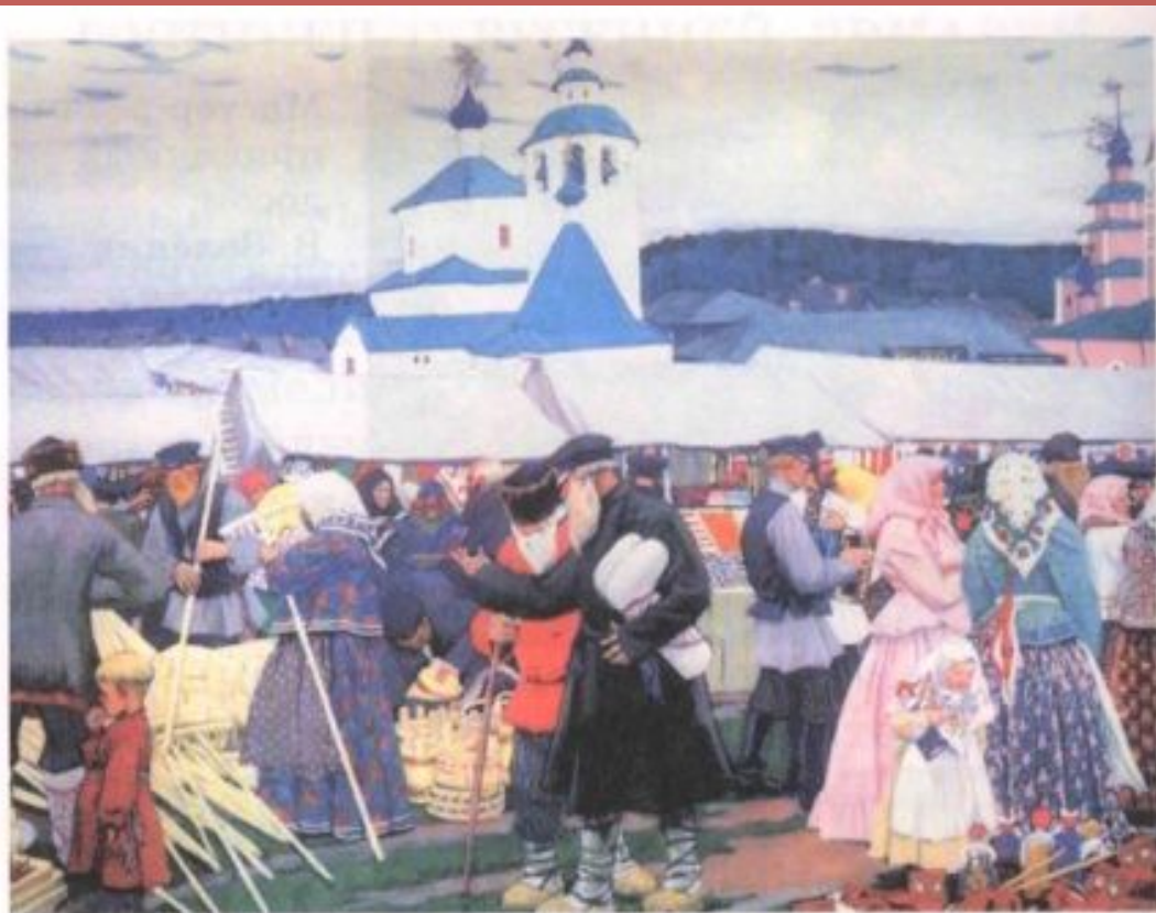
В. КУСТОДИЕВ. Ярмарка.

Золотая хохлома - это нарядная, красочная деревянная посуда, которой издавна торговали на весёлых ярмарках в старинном селе ХОХЛОМА.