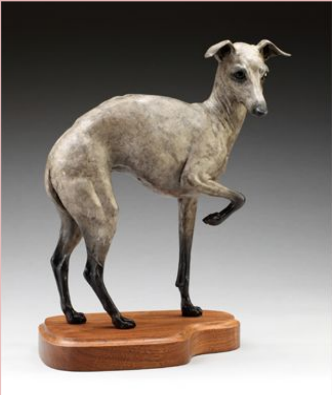
Little Diva Tammy Bailly, Twentieth Century bronze, Gift of The Art Show at The Dog Show