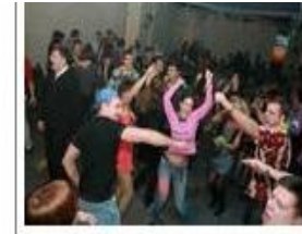
Ведущий на праздник корпоратив организация... 250×185 ... 1000×667 www.5895316.ru похожие