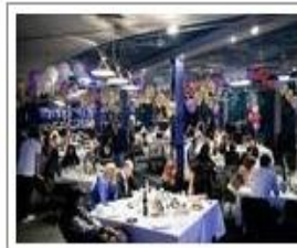
Корпоративные праздники. 100×75 ... 800×533 bestshowcenter.ru похожие