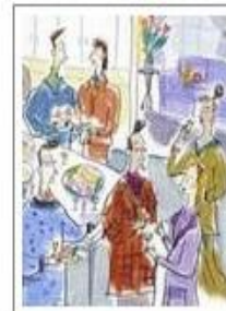
...корпоративные праздники для своих сотрудников. 120×120 ... 520×601 partyinfo.ru похожие