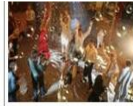
корпоратив, праздник, работа. корпоратив... 400×267 ... 640×427 faqlife.ru