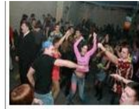
Ведущий на праздник корпоратив организация... 250×185 ... 1000×667 www.5895316.ru похожие