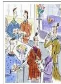
...корпоративные праздники для своих сотрудников. 120×120 ... 520×601 partyinfo.ru похожие