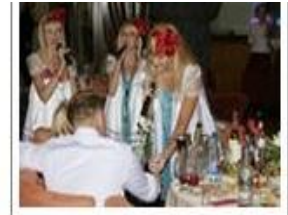
Корпоративные праздники. 250×174 ... 800×557 image-hall.perm.ru похожие