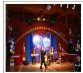
Фотогалерея - Корпоративные праздники. 800×600 www.art-garmony.ru похожие