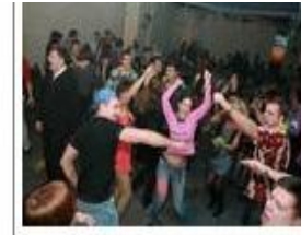
Ведущий на праздник корпоратив организация... 250×185 ... 1000×667 www.5895316.ru похожие