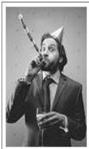
Фотографии Корпоративные праздники. 220×260 ... 371×406 www.board.ua похожие