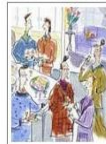
...корпоративные праздники для своих сотрудников. 120×120 ... 520×601 partyinfo.ru похожие