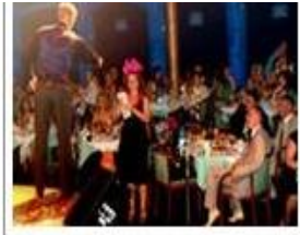
Организация корпоративных праздников. 120×79 ... 1024×683 www.ua.all-biz.info