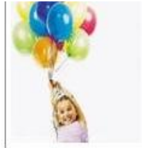
Корпоративы и праздники! Корпоратив. 120×80 ... 400×400 wear.sellall.ru похожие