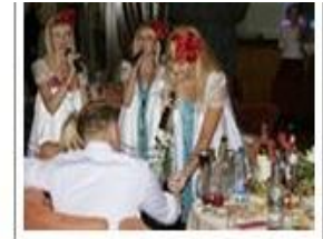
Корпоративные праздники. 250×174 ... 800×557 image-hall.perm.ru похожие