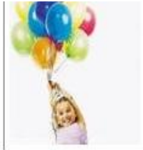
Корпоративы и праздники! Корпоратив. 120×80 ... 400×400 wear.sellall.ru похожие