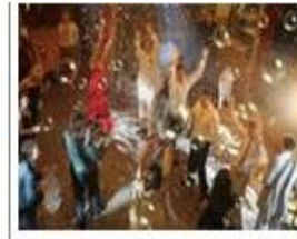
корпоратив, праздник, работа. корпоратив... 400×267 ... 640×427 faqlife.ru