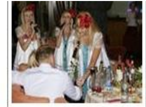
Корпоративные праздники. 250×174 ... 800×557 image-hall.perm.ru похожие