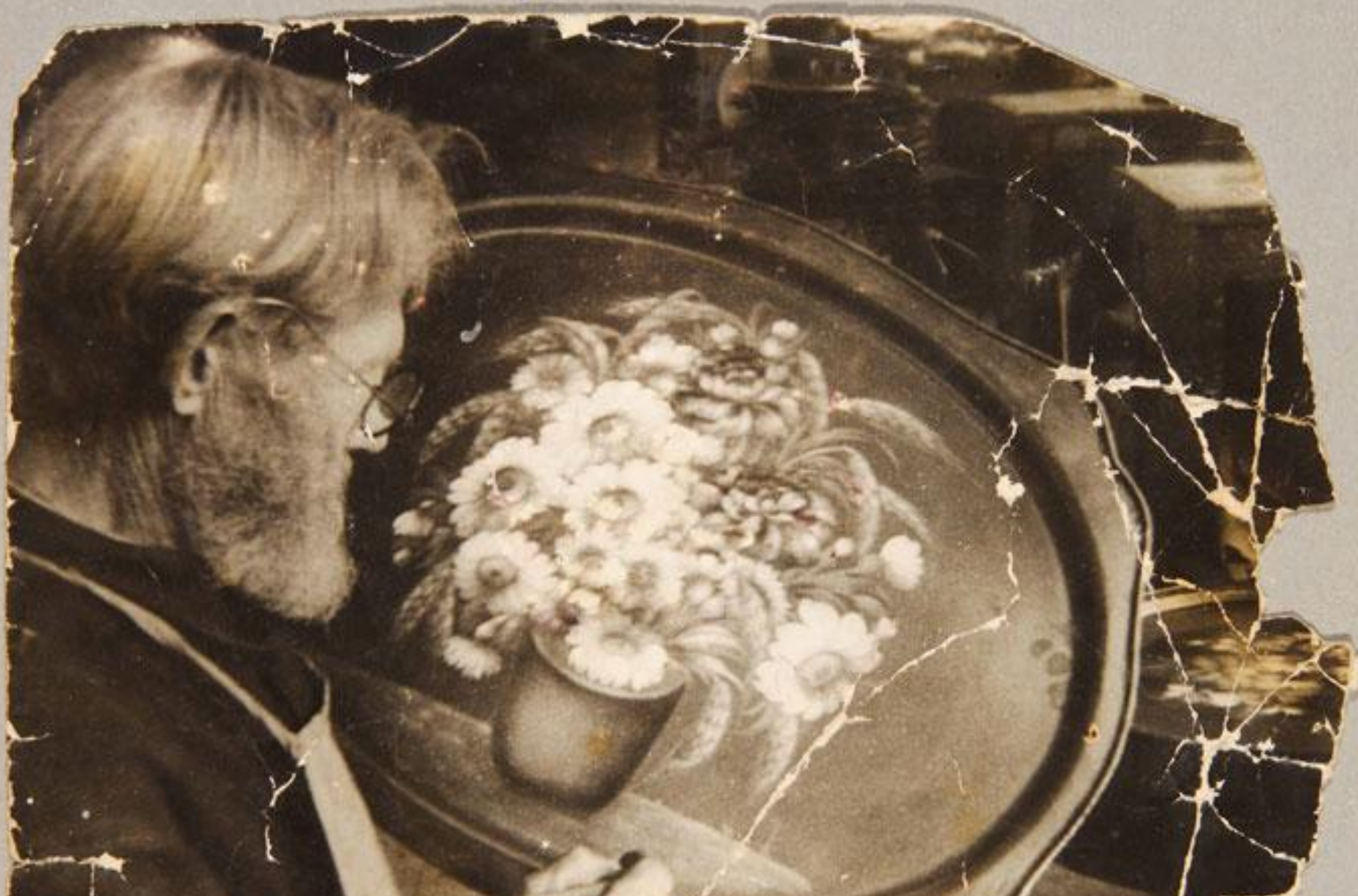
Жостовский мастер не работает по образцам, перед ним нет и живых цветов.