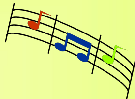
Детские музыкальные школы №1, №4