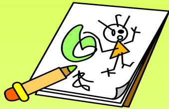
Дом детского творчества