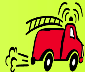
Пожарно- техническая выставка