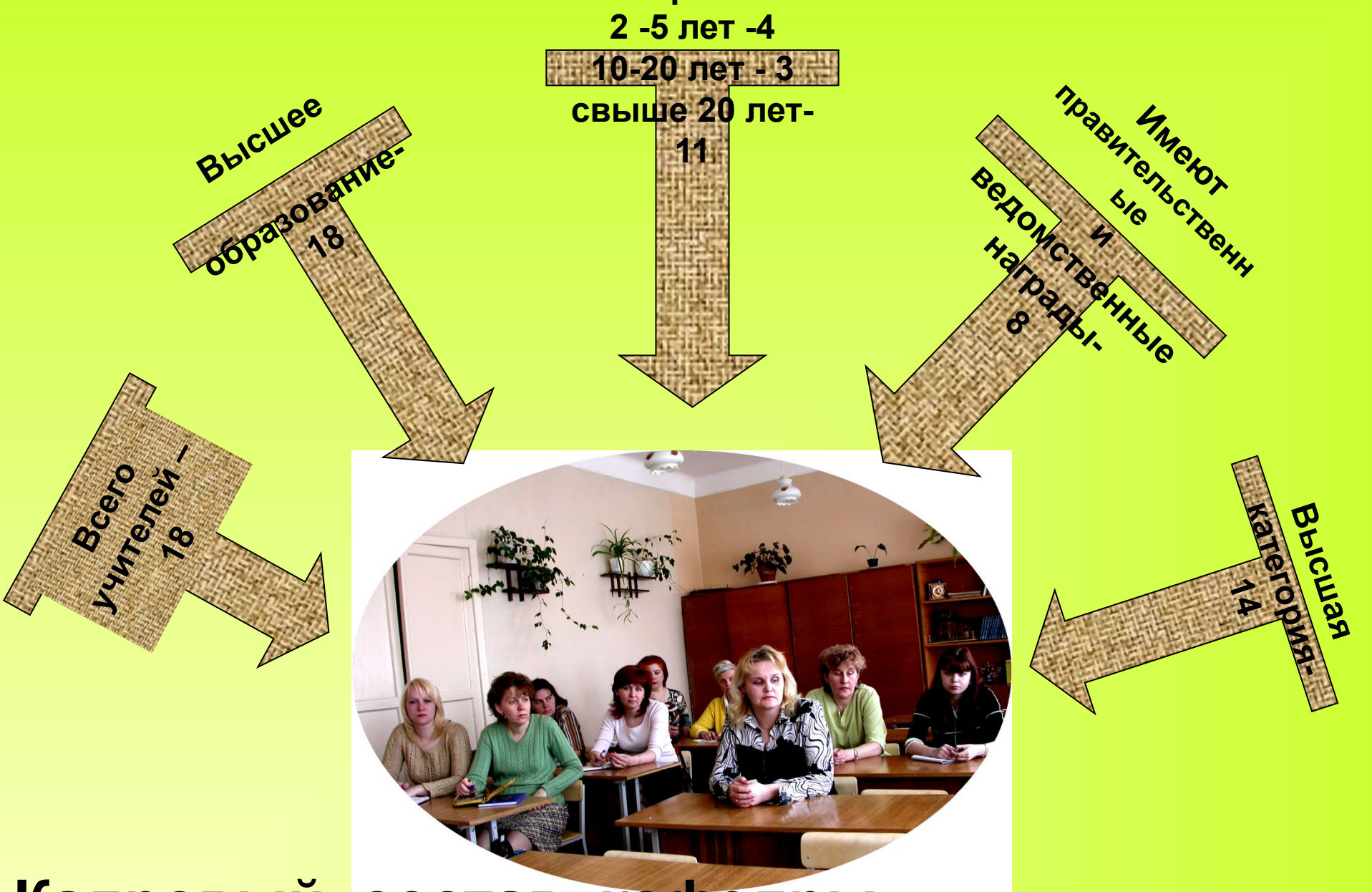
Кадровый состав кафедры