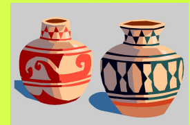
Историко- художественный музей