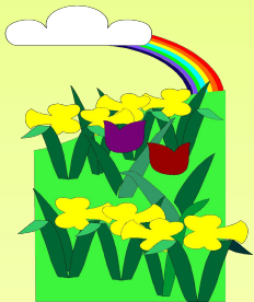
Эколого- биологический центр