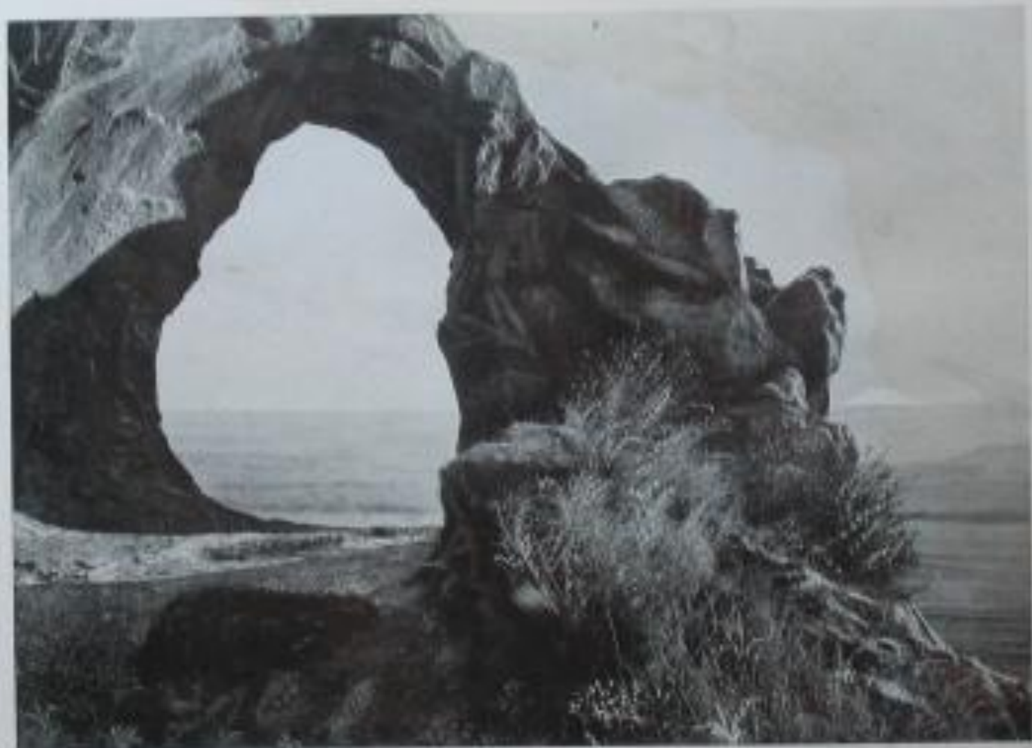
Окр. Кисловодска. Каменный Мост и Эльбрус.