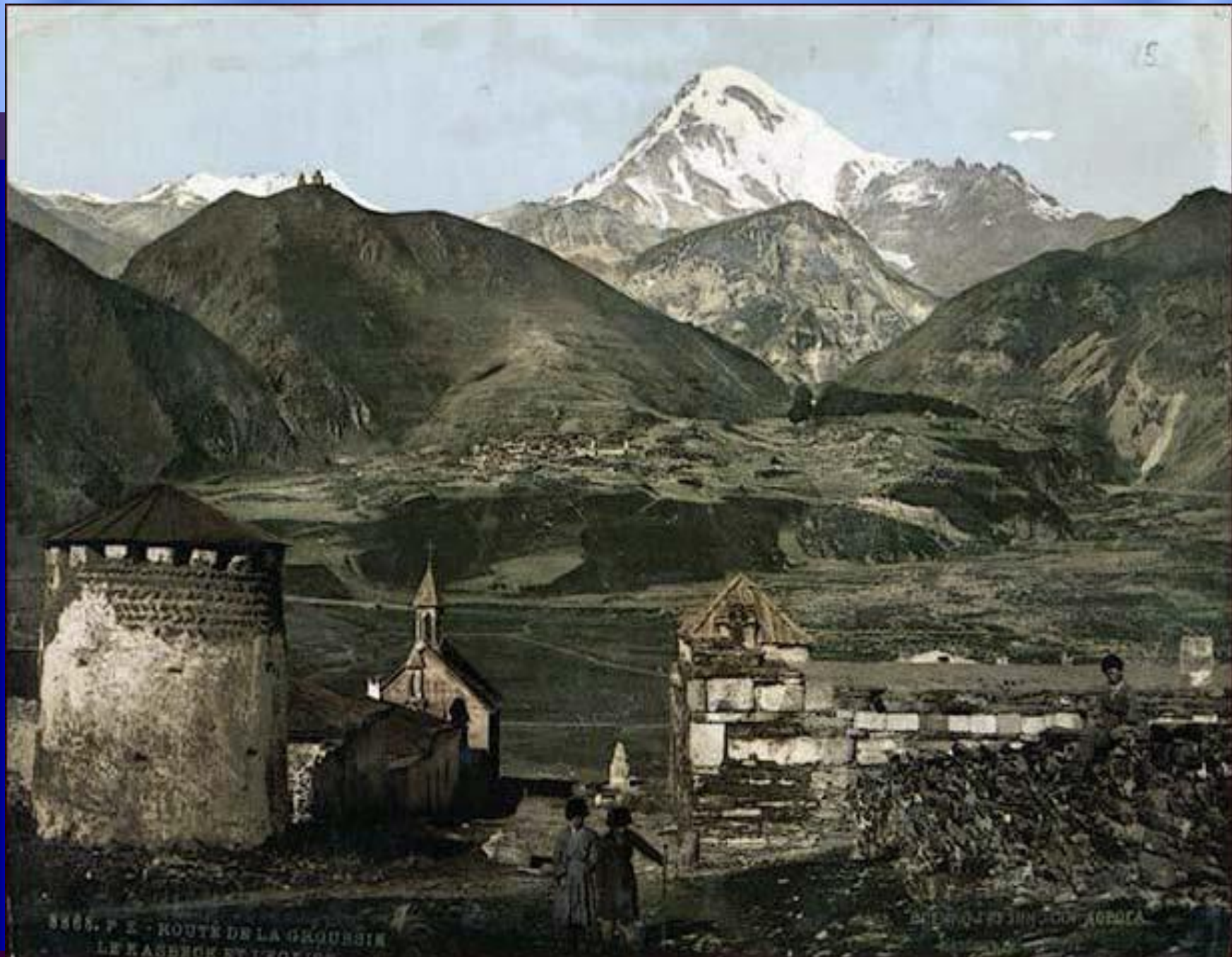
1885. P. E. - ROUTE DE LA GEORGIE LE KASBECK EN TROIS