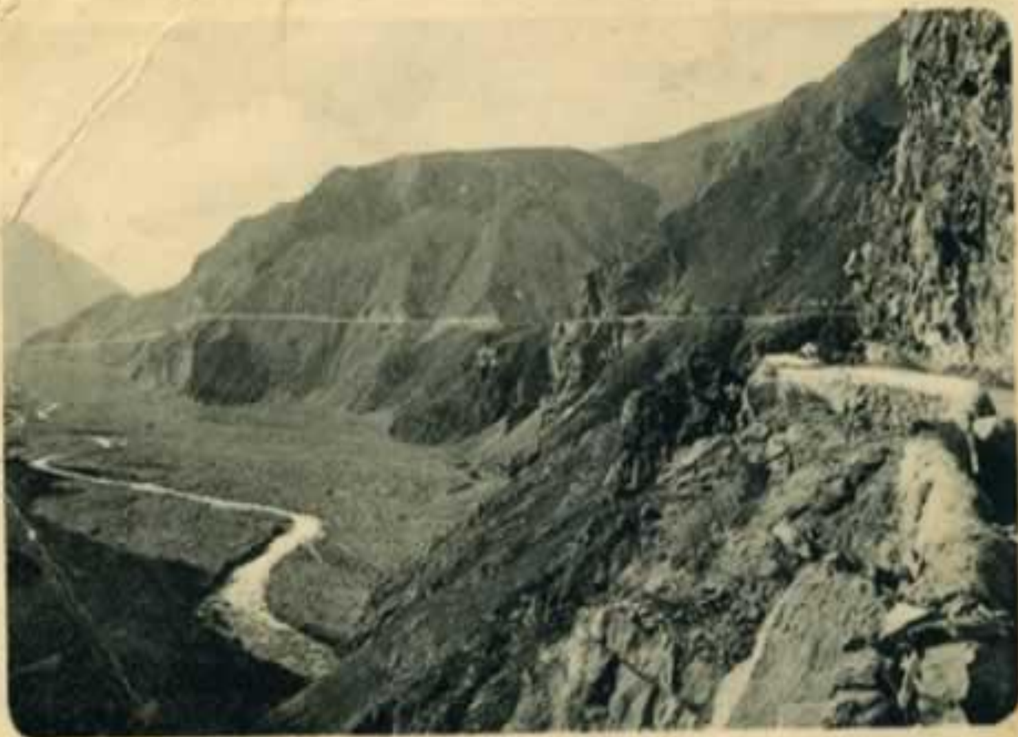
Воен.-груз.-дор. По карнизамъ Терекскаго ущелья.

Наб. П. Сивина от Стамбула на горе Идрисово-дере.