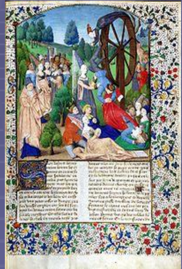
Иллюстрация к книге Боккаччо «О несчастиях знаменитых людей»: Фортуна крутит колесо удачи. Париж, 1467