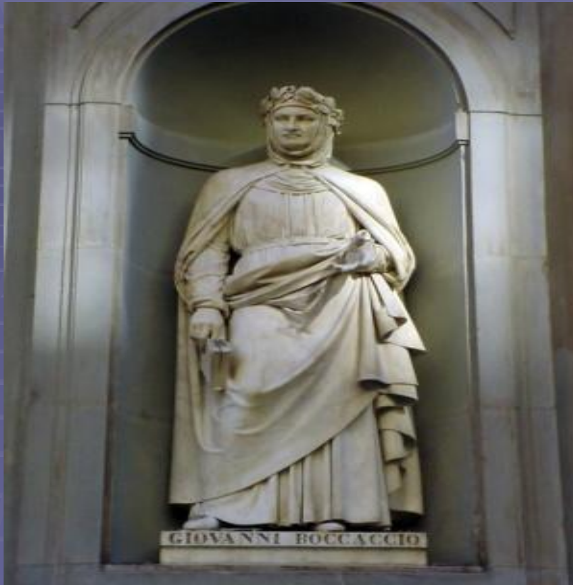
Итальянский Ренессанс. Статуя у дворца Уффици