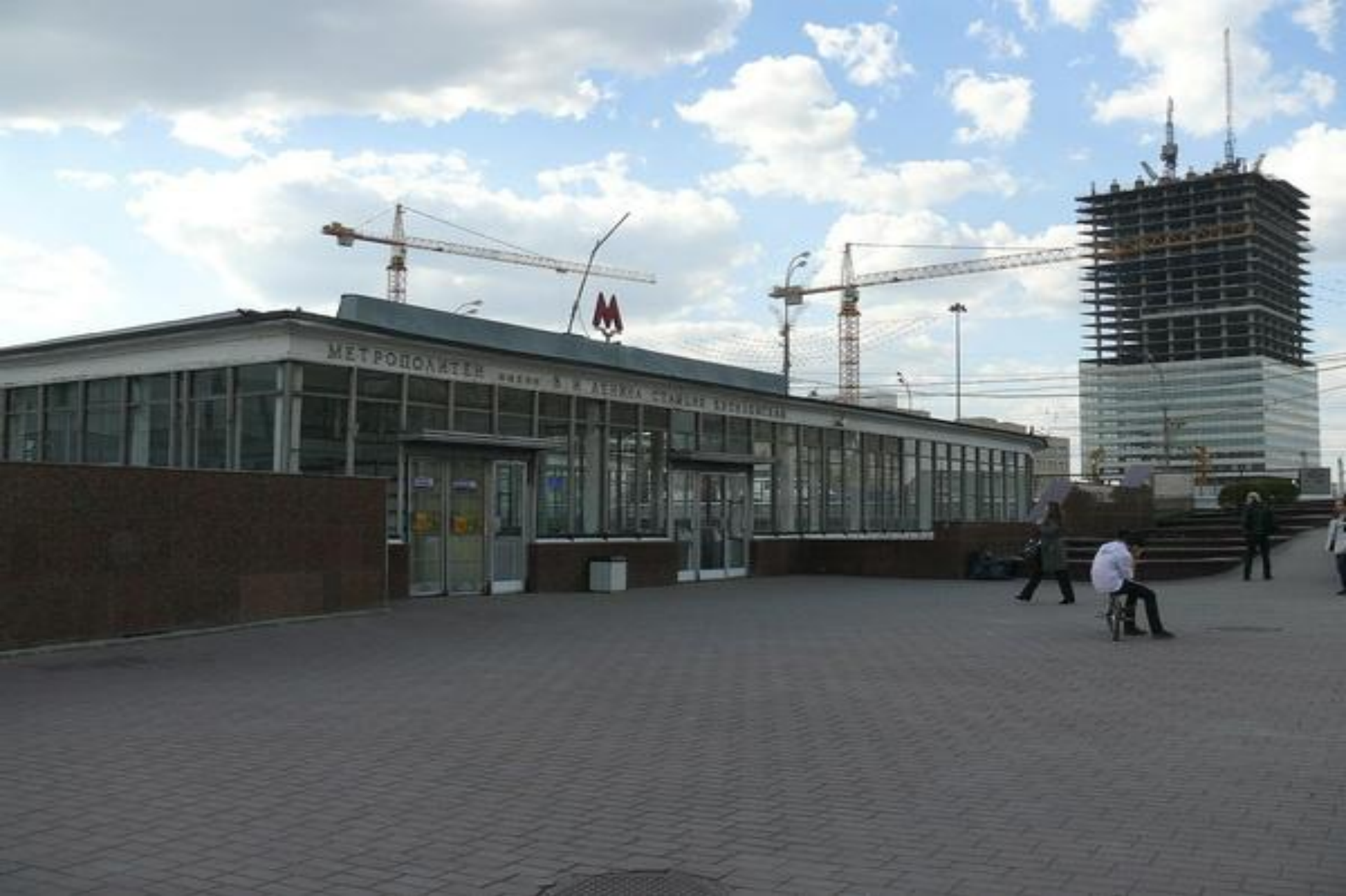
Метро станция «Кутузовский проспект»