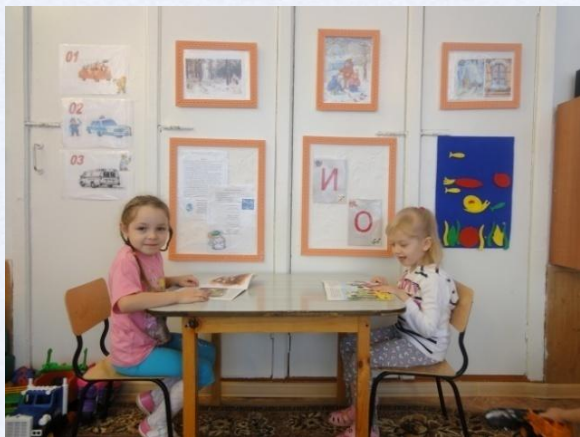
Речевой уголок в группе