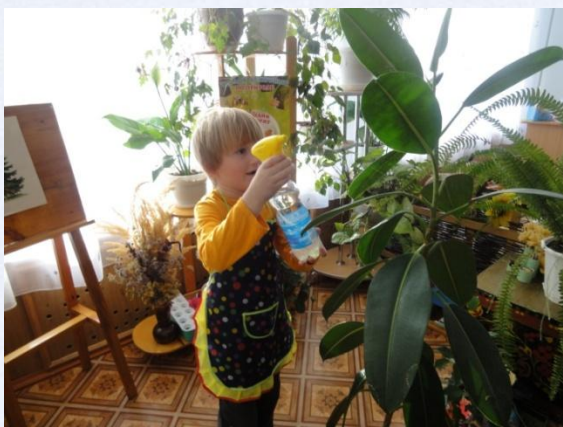
Дежурство в уголке природы