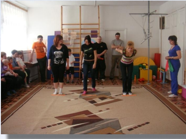
«Мама, папа, я спортивная семья»