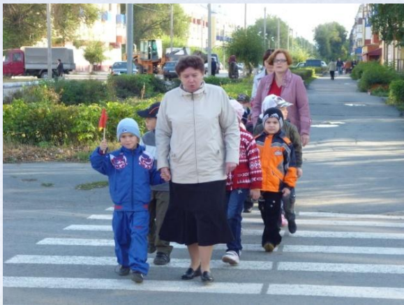
Экскурсия по родному городу