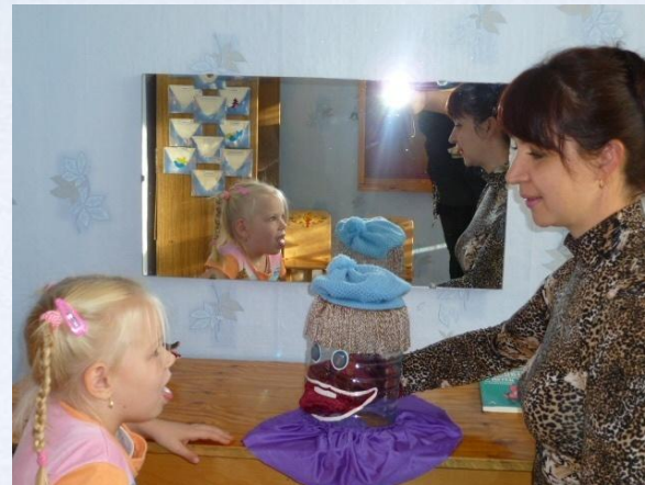
Индивидуальная работа учителя - логопеда