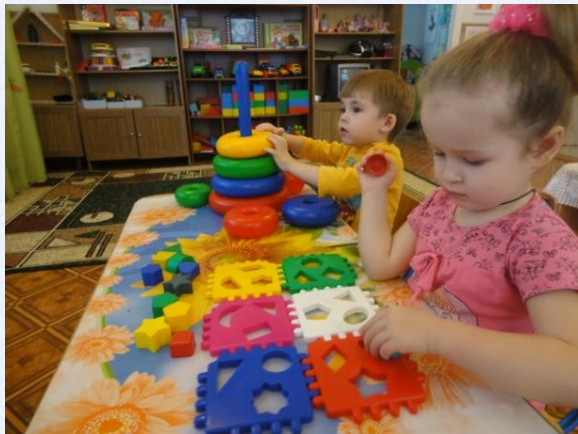
Развитие мелкой моторики