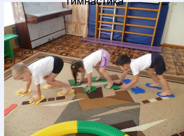
Корректирующая гимнастика после сна