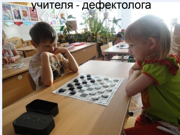
Шашки – это интересно!