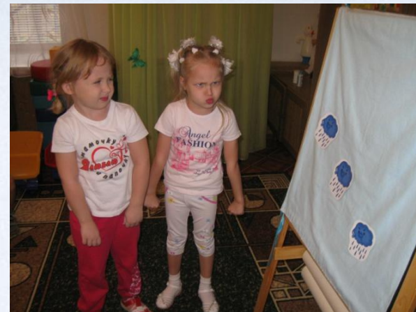
Индивидуальная работа педагога-психолога по теме «Эмоции»