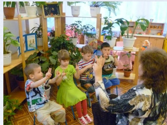
Подгрупповое занятие учителя - дефектолога