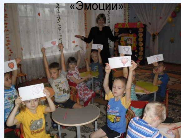
Подгрупповое занятие педагога-психолога по теме «Эмоции»