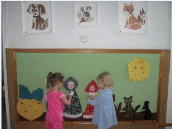
«В гостях у сказки»