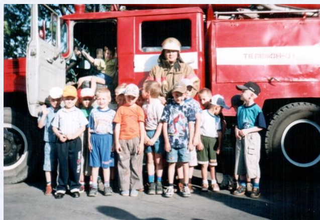
Экскурсия в пожарную часть