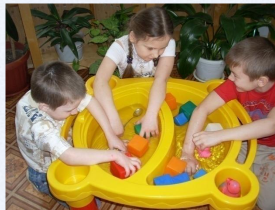
Опытно-экспериментальная деятельность детей