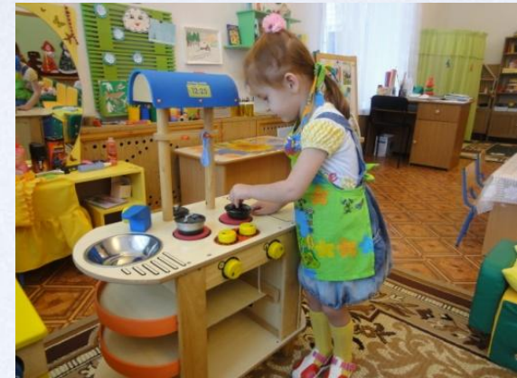
Сюжетно-ролевая игра «Дом»