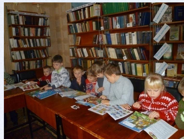
Экскурсия в библиотеку