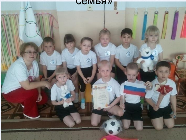
Спортивное развлечение «Мы - будущие олимпийцы»