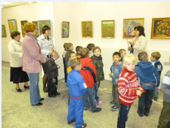
Экскурсия в «Выставочный зал»