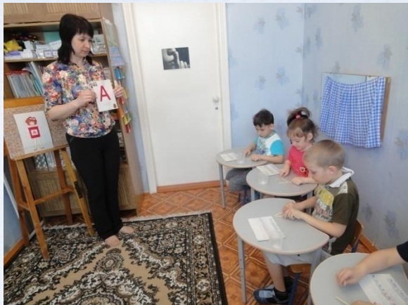
Подгрупповое занятие учителя - логопеда