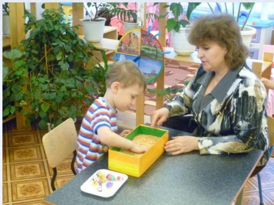
Индивидуальная работа учителя - дефектолога