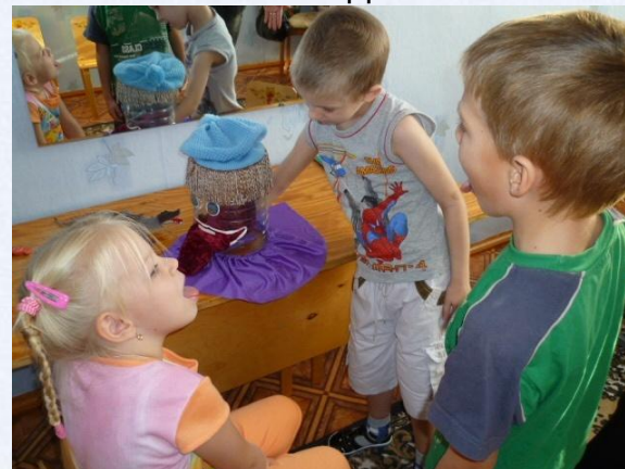
Самостоятельная деятельность детей