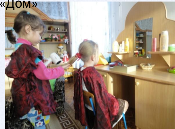
Сюжетно-ролевая игра «Парикмахерская»