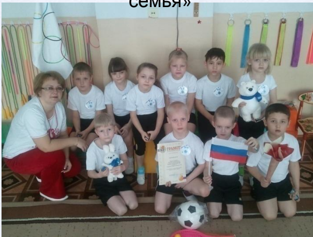
Спортивное развлечение «Мы - будущие олимпийцы»