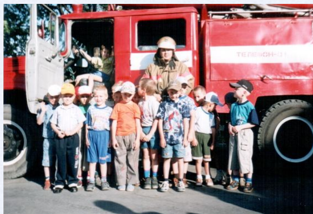
Экскурсия в пожарную часть