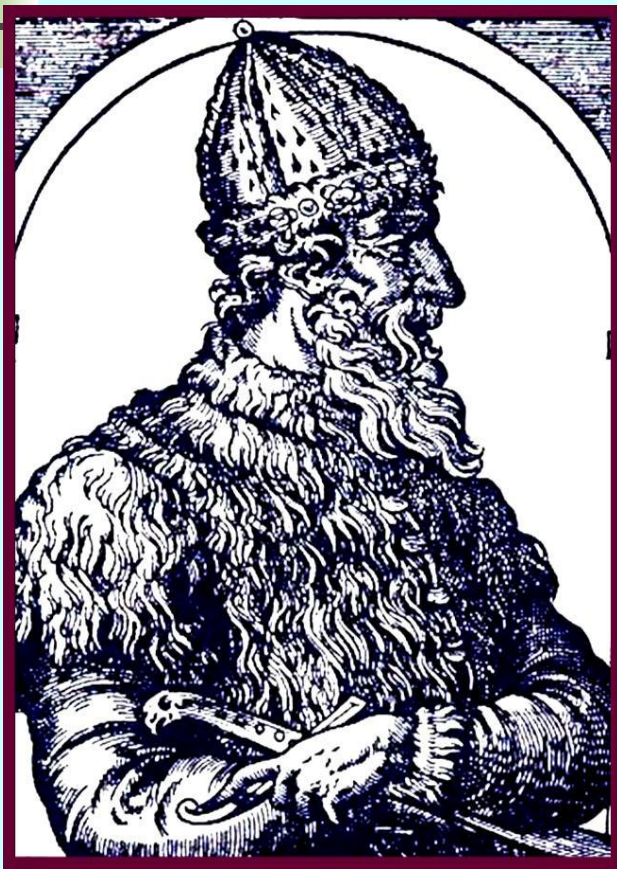
Иван III. Гравюра из «Космографии» А. Теве. 1584 г.