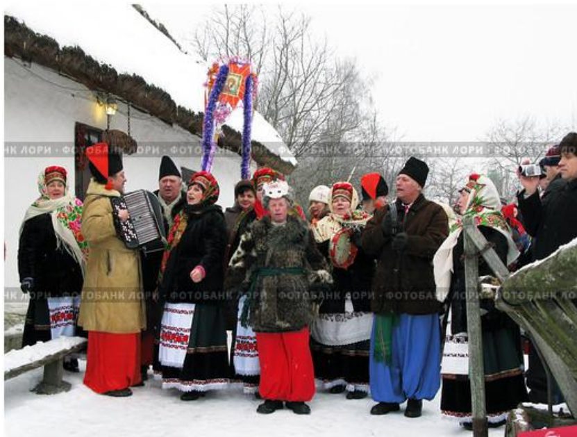
Колядки на Рождество

А третій же празник Святе Водохреще. Радуйся, ой радуйся, земле, Син Божий народився.