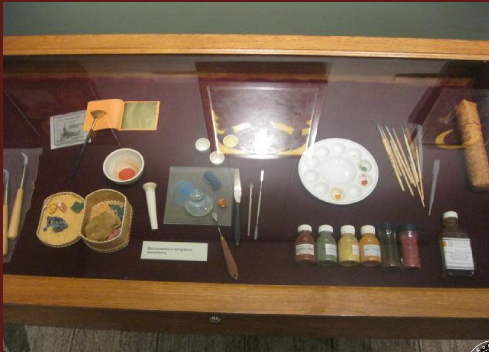
Инструменты и материалы шаманизма